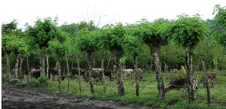
Кампешевое дерево.