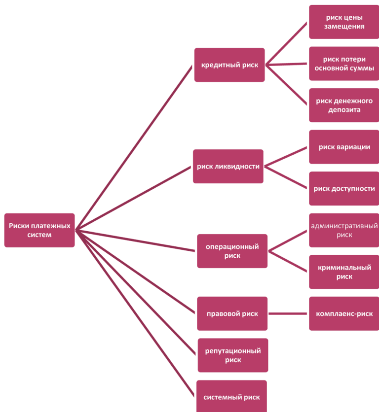
Рис. 1.3.1. Классификация рисков платежных систем.

В общем виде классификация рисков платежных систем представлена на рис. 1.3.1.