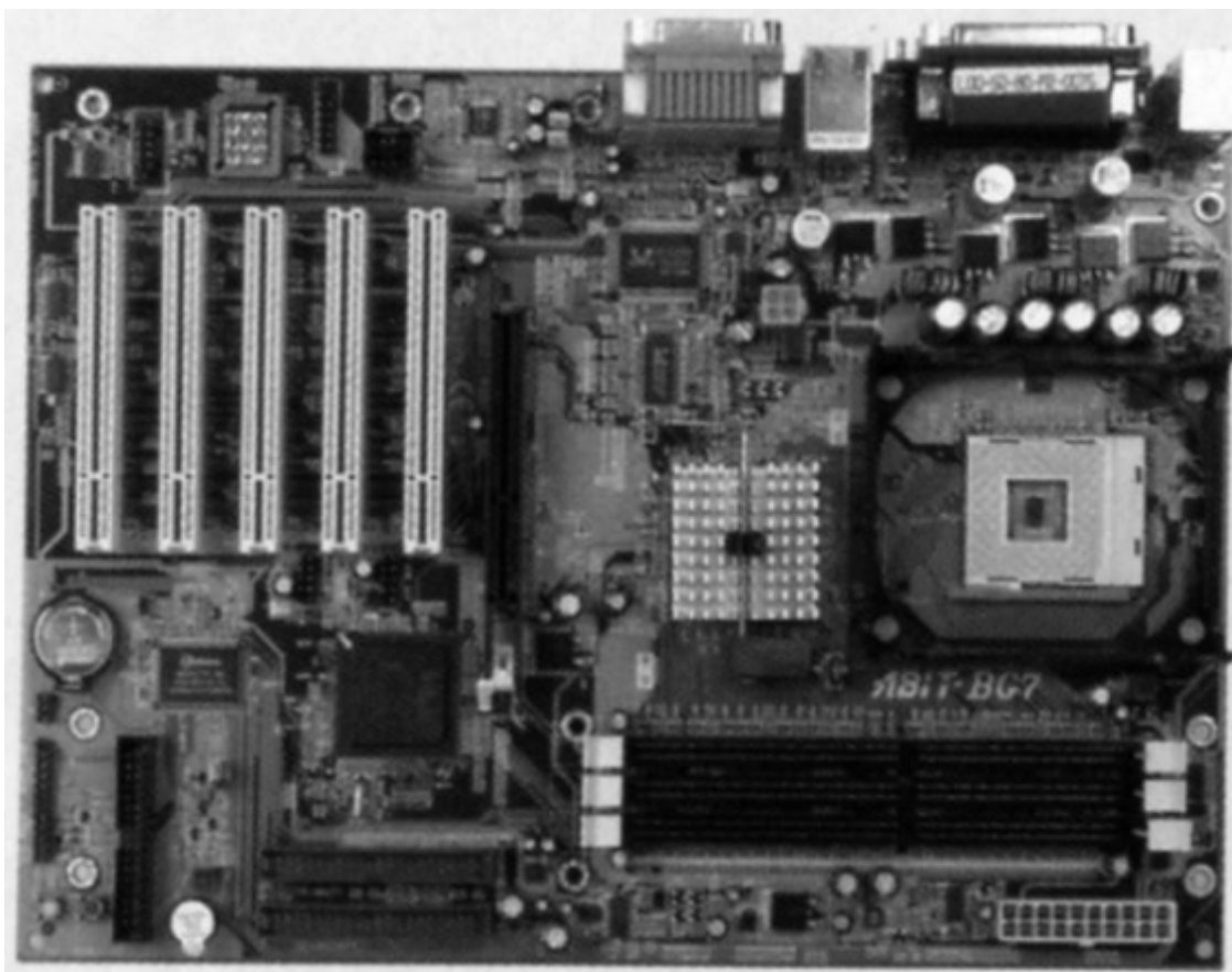
Системная (материнская) плата

Системная (материнская) плата – это один из самых важных элементов нашего персонального компьютера. Она служит механической основой всей электронной схемы компьютера. На ней расположены: процессор (мозг ПК), проложены шины, расположены гнезда и разъемы для подключения с дополнительными модулями и периферийными устройствами, установлен целый ряд микросхем, генерирующий необходимое управление сигналами для функционирования компьютера и его памяти.