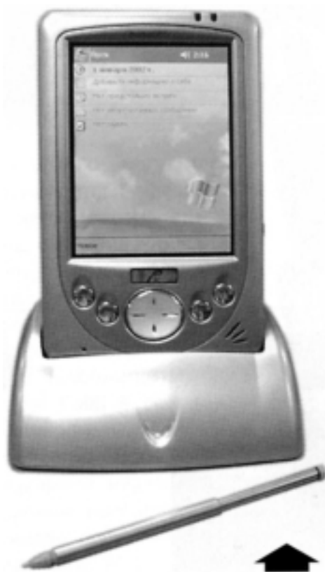
КПК Rover PC P3

Персональный цифровой помощник PDA или в русском переводе КПК. Карманный переносной компьютер, не более размера записной книжки. Заявил о себе в начале 90-х годов. Карманных компьютеров в нашей стране становится все больше и все большим спросом он пользуется. Появились российские КПК. Один из первых КПК Rover PC P3, он работает на базе ОС PocketPC 2002, который является «карманным Windows». Его характеристики типичны для недорогих машин этого семейства, хотя есть и интересные нюансы. Используется процессор Intel Xscale с частотой 200 Мгц, снизилось энергопотребление, что очень важно. При обычной эксплуатации КПК работает 3–5 часов непрерывно. Имеет изящный корпус, удобную четырехпозиционную навигационную клавишу, а также кнопки вызова приложений с подсветкой. Приличная аудио подсистема, более яркий TFT-экран. Одно но, маловато памяти, всего 29 Мб ОЗУ. Любое серьезное применение потребует дополнительной карточки памяти (рекомендуемые SD Card или MMC объемом от 64 Мб).