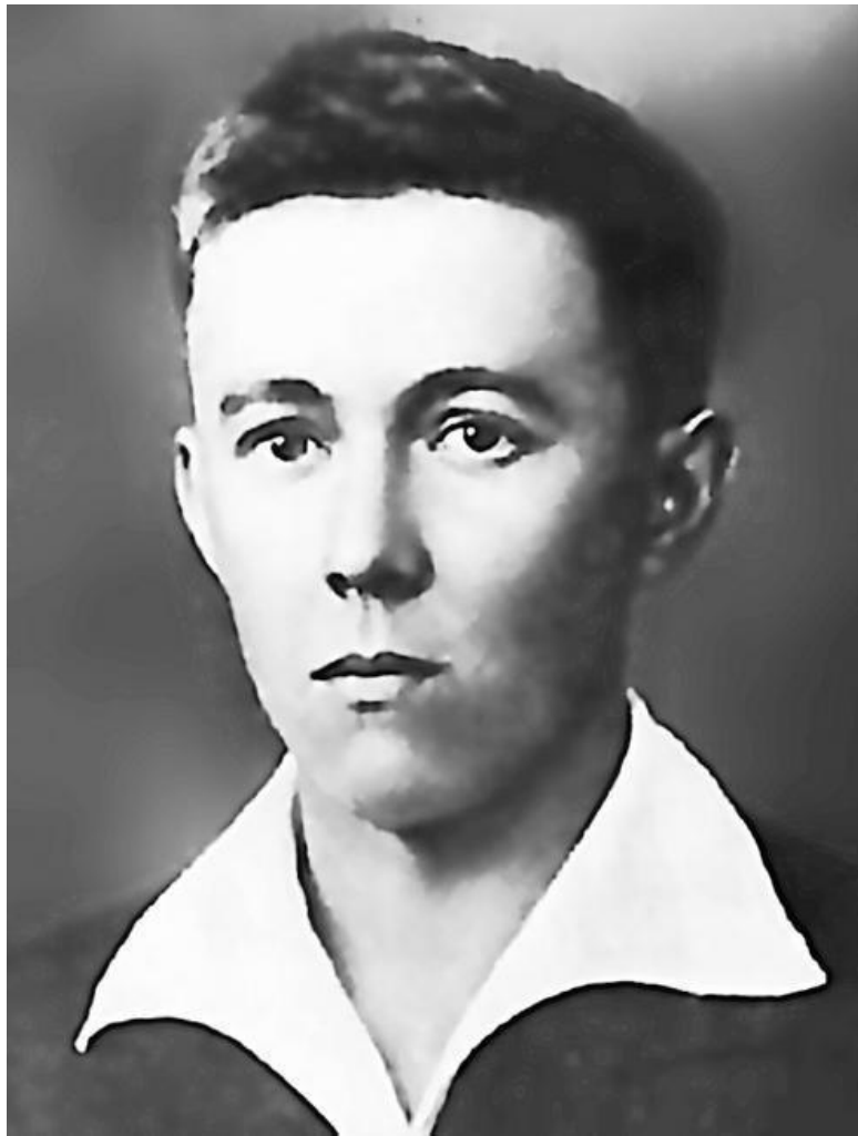
Студент заочного отделения Московского института ис-