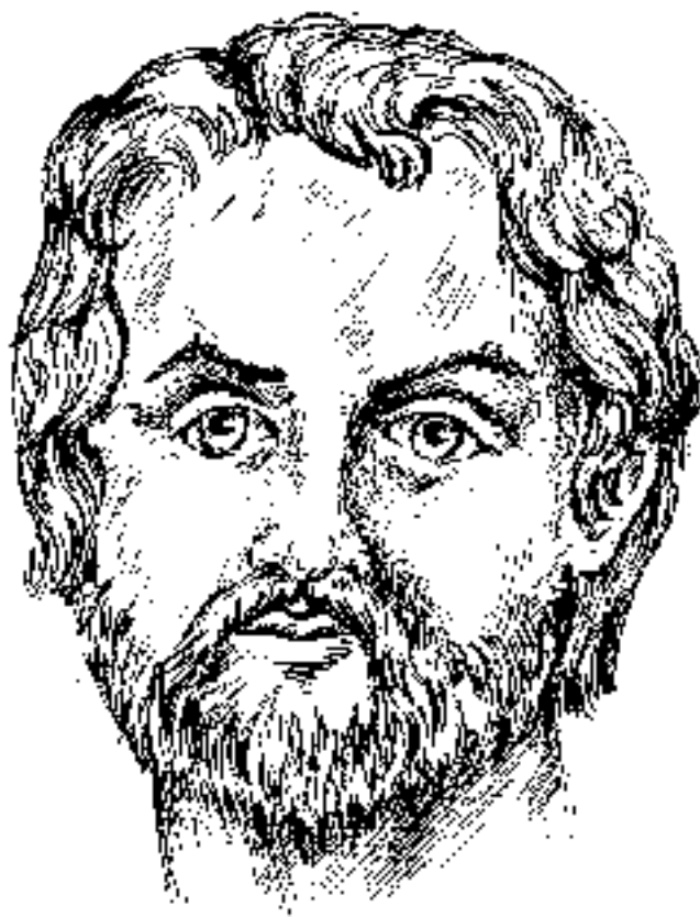
Царь Македонии Филипп II

Свадьба проходила в Эгах – древней столице Македонии. Большой праздник, устроенный Филиппом, был своеобразной демонстрацией всем балканским подданным, эллинам и македонцам могущества Македонской державы, а также символом восстановления семейного мира.