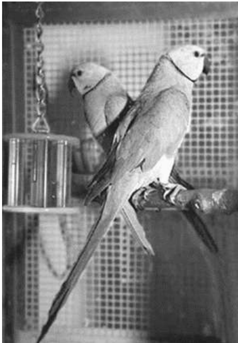
пара Кольчатых попугаев

Кроме зерновой смеси, попугаям необходимо давать добавочные корма – густые каши, муравьиные яйца, мучных червей, вареные куриные яйца, творог, белый хлеб, намоченный в молоке или сладком чае, и т. д. Каши варят на молоке, разбавленном водой, без масла. В зимнее время и в период выкармливания птенцов в кашу рекомендуется добавлять рыбий жир (на 100 г каши 0,5 г рыбьего жира).