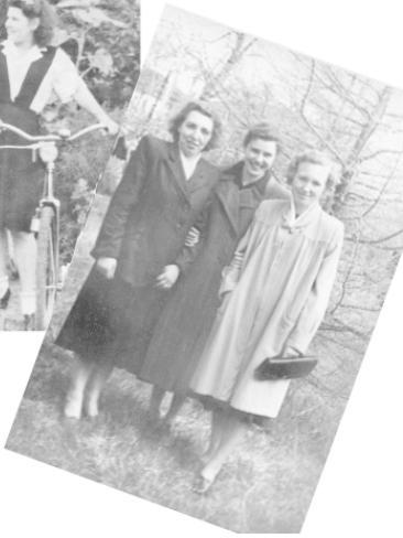
Однажды мы с сестрой поехали туда покупать ей сапоги.