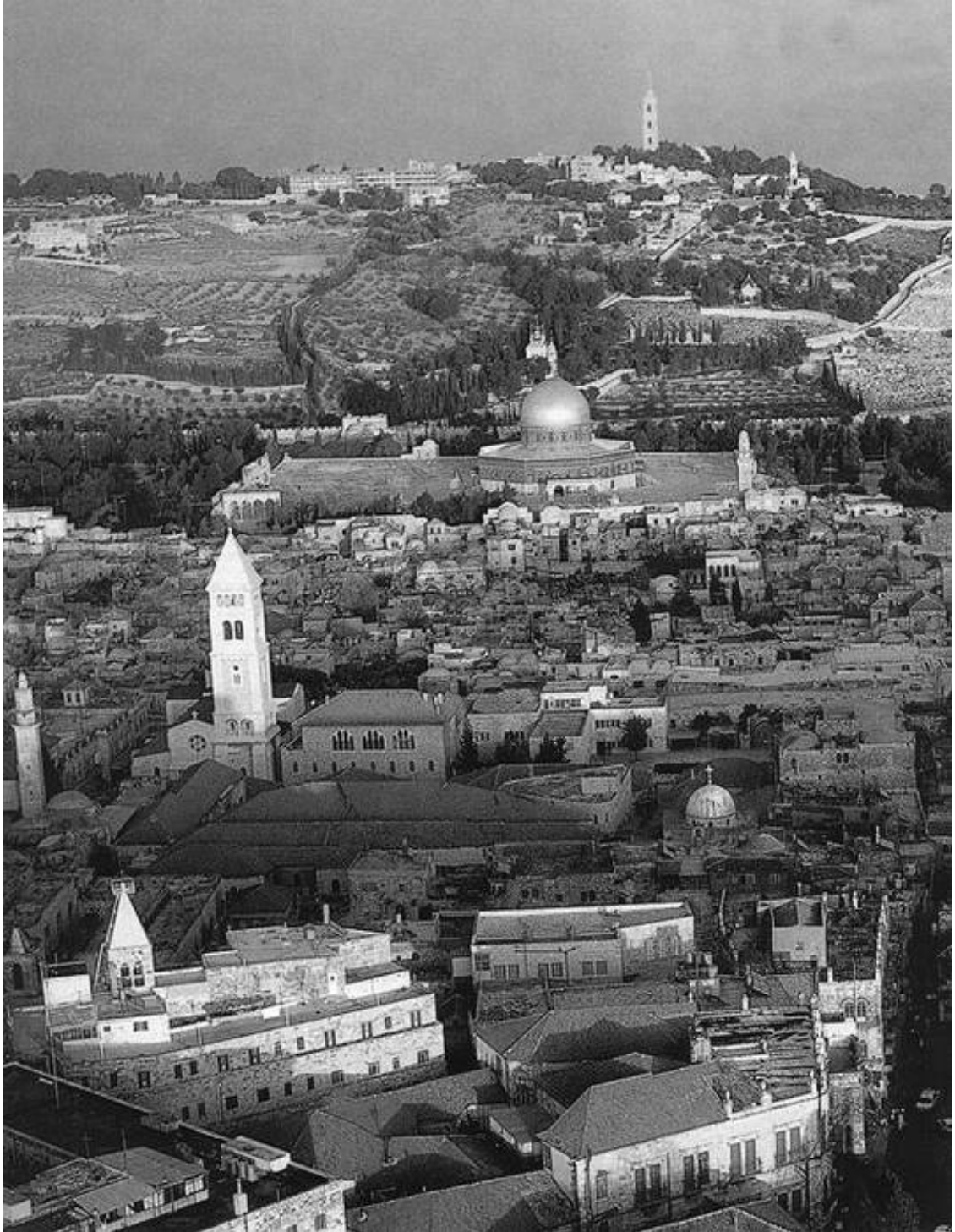
Рис. 2. Иерусалим. Вид на Старый город

Сорок лет длилось царство Давида, сорок лет он побеждал врагов, и всегда ему сопутствовал успех во всех начинаниях. Только уже в глубокой старости его многочисленные дети начали делить престол. Каждый старался перехватить власть после смерти Давида. Трудно было принять решение царю. И чтобы не допускать междоусобиц и кровопролитий, он решил помазать на царство Соломона, родившегося от его жены Вирсавии. Затем Давид умер, а Соломону пришлось справляться со своими врагами и врагами своего отца.