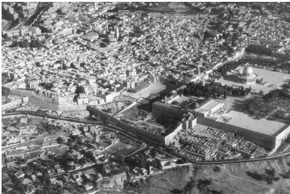
Рис. 1. Иерусалим. Панорама города