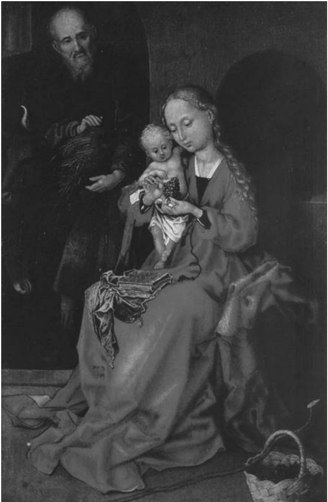
Рис. 3. Мартин Шонгауэр. Святое семейство. Ок. 1475–1480