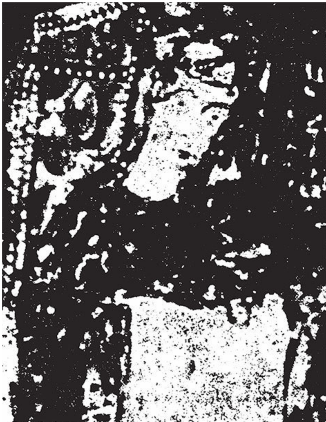
Мефодий Солунский (фреска IX в.)

Однажды в комнате с разохшимся полом, который кусал босые ноги, он впервые услышал о нападках на них. Начались столкновения с триязычниками, немцами, выступавшими за то, что обрядовыми могут быть только три языка (греческий, латинский и еврейский). В Паннонии, на Балатоне – озере, где зимой смерзаются волосы, а глаза от ветра становятся похожи на столовую и чайную ложку, – Мефодий остановился вместе с братом в столице тамошнего славянского князя Коцеля. Его воины в бою кусались так же страшно, как кони и верблюды, змей они ударами прута заставляли покинуть кожу, а их женщины рожали в воздухе, подвешенные к святому дереву. Они укрощали рыб в грязи паннонских болот и показывали пришельцам старика, молитва которого состояла в том, что он вынимал из грязи рыбу, клал ее себе