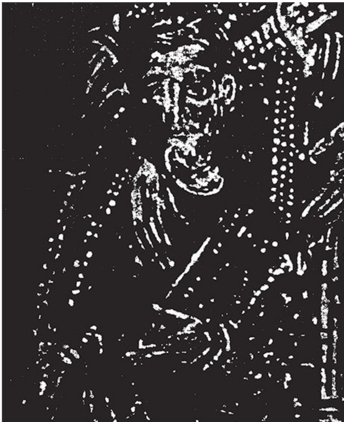
Портрет Константина Солунского – святого Кирилла (фреска IX в.)

Тогда его век перевалил за середину и закончилась первая половина его жизни.