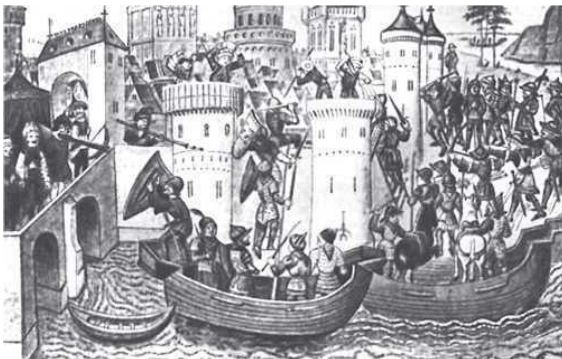
Взятие турецкими войсками Константинополя. Средневековая гравюра.

Византия же после этого «крестового похода» так и не смогла полностью восстановиться, а через два с половиной столетия закончила своё существование. Как пишут историки, – в результате захвата Константинополя турками.