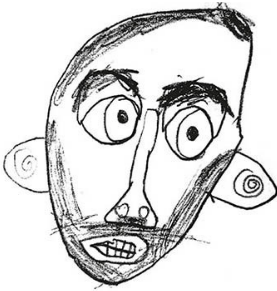
Иллюстрация Мирона Лысикова, карандаш