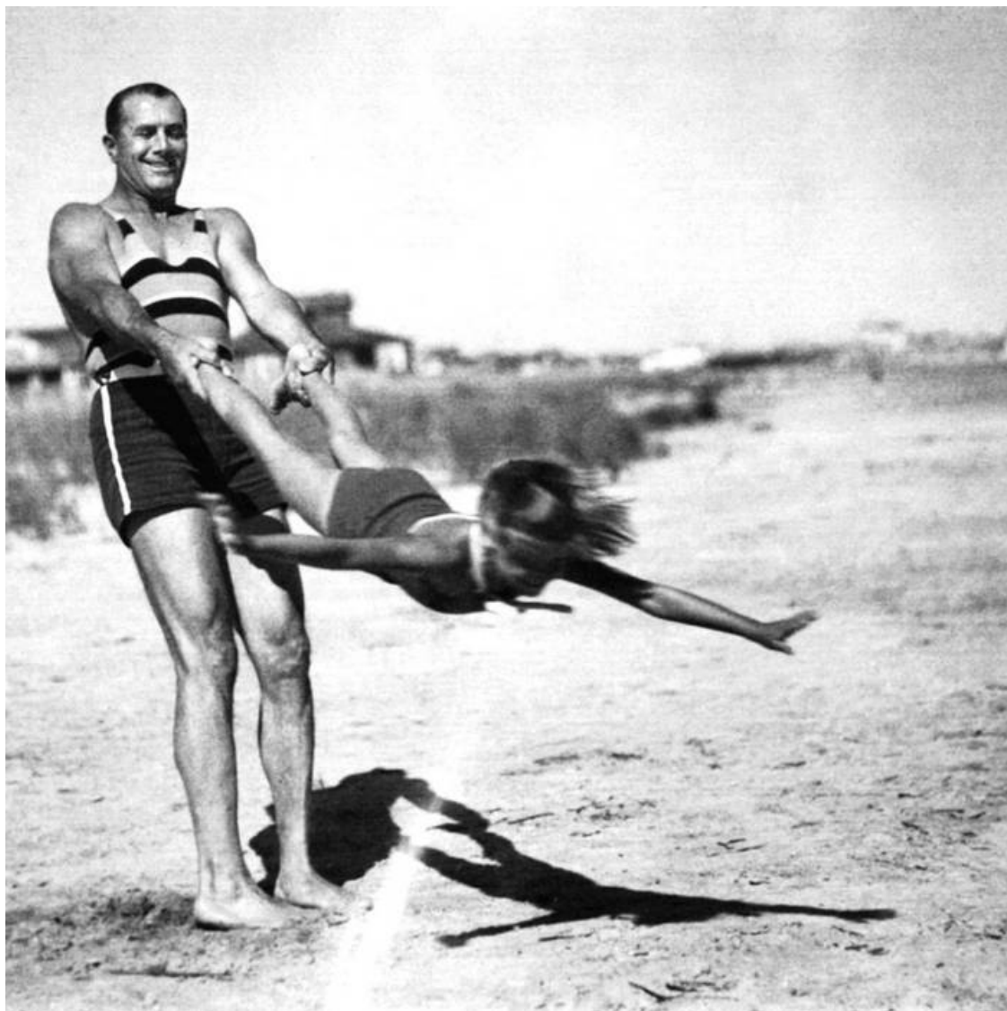
Счастливые минуты детства

После крушения своей первой любви Грейс пустилась во все тяжкие. Сестры даже подозревали, что ее самозабвенный флирт и попытки очаровать все новых и новых парней являются внешним выражением глубоко переживаемой вины перед Харпером... Грейс буквально прославилась своей доступностью. Один из ее кавалеров рассказал в интервью: «Уверен, что до окончания школы она все еще оставалась девушкой. Однако не сомневаюсь, что все остальное она прошла от и до».