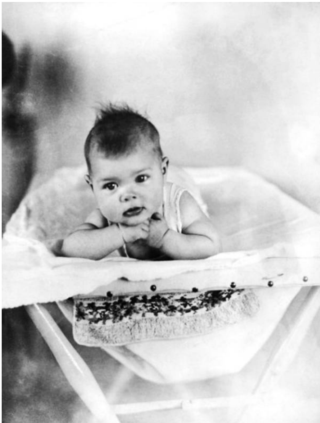
Юное дарование – Грейс Келли. 1930 г.

Она была такой тихой. Такой мечтательной. Часами играла в куклы, разыгрывая целые представления. В абсолютном одиночестве – в детстве у нее даже подруг-то не было. Зато кукол для ее представлений нужно было много, и сестры щедро отдавали ей своих. Сами они предпочитали более веселые и подвижные игры на свежем воздухе. А Грейси, дай ей волю, вовсе не выходила бы из своей комнаты.