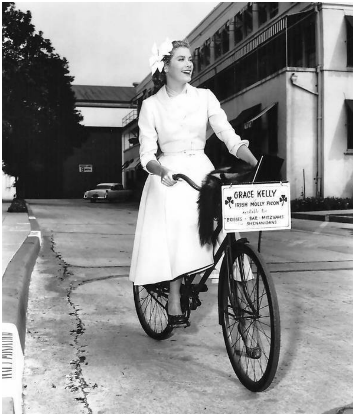
На именном велосипеде

А самым знаменитым представителем богемы в их семье был еще один брат Джека, драматург Джордж Келли. Его пьесы до сих пор идут на сценах США. Дядя Джордж очень любил свою застенчивую племянницу и старался помочь в ее духовном становлении, подбирал книги для чтения, приглашал ее на вечерние чаепития – ее одну из всей семьи! – а Грейс обожала дядю Джорджа: он единственный считал ее не хуже, а лучше других. Возможно, влияние Джорджа Келли тоже сказалось на желании Грейс стать актрисой.