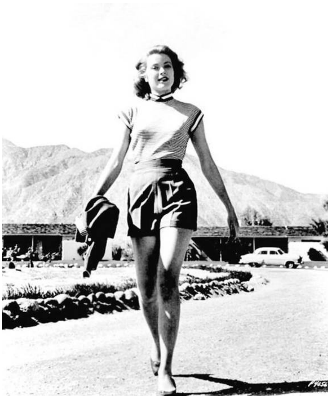
Молодой актрисе 17 лет. 1947 г.

Шел 1944 год. Харпер Дэвис поспешил записаться во флот, чтобы успеть проявить себя героем, пока война не закончилась. Он думал, что такая демонстрация мужества убедит Джека Келли, что он, Харпер, достойный жених для Грейс. Он получил тяжелое ранение, в результате которого у него возникла прогрессирующая атрофия мышц. Остаток жизни первый возлюбленный Грейс провел в госпитале для ветеранов.