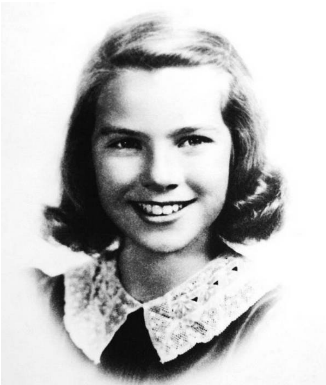
Школьные годы... 12 лет. 1942 г.

«Был такой период между четырнадцатью и шестнадцатью годами, – вспоминала ее мать, – когда внешне она ровно ничего из себя не представляла: вечно хихикающая девчонка с писклявым, слегка гнусавым голоском. У нее всегда были проблемы с носом. От этого ее голос звучал как-то по-особенному. А так как она любила покушать, то это не преминуло сказаться на ее весе. Кроме того, Грейс страдала близорукостью и вынуждена была носить очки».