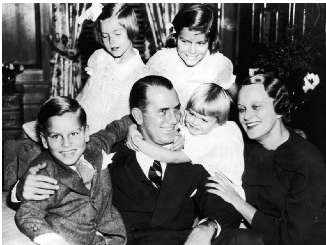
Дружная семья Келли

«У нее был прекрасный цвет лица, он был просто потрясающим, такой свежий, ясный, – вспоминал одноклассник ее брата. – Это было ее самой лучшей чертой и никогда не получалось на фотографиях».