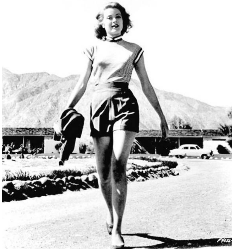
Молодой актрисе 17 лет. 1947 г.