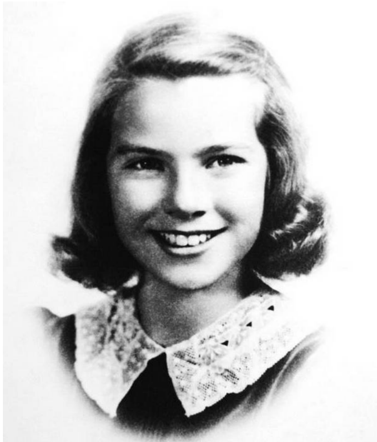
Школьные годы... 12 лет. 1942 г.