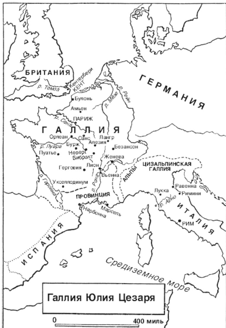
Галлия Юлия Цезаря