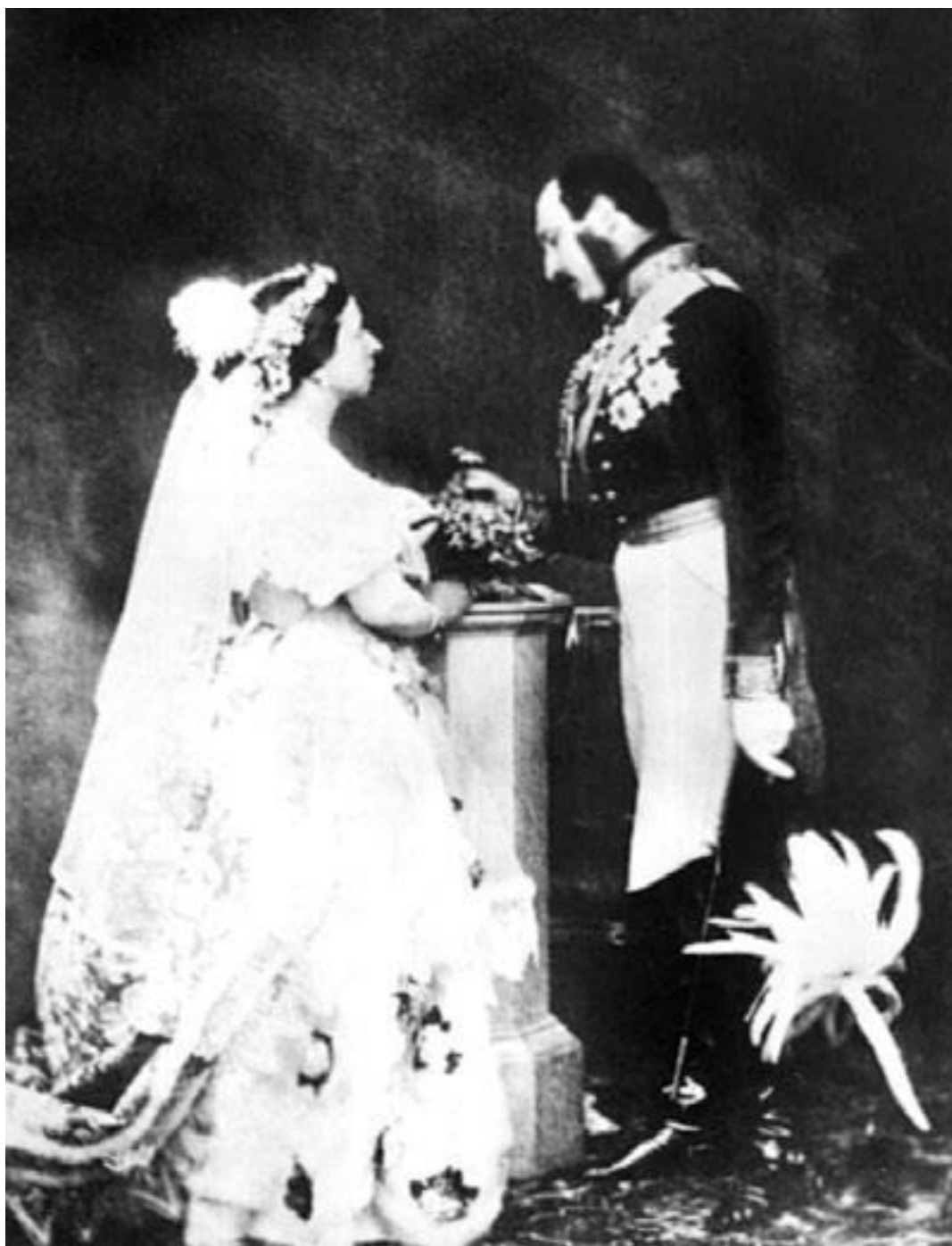
Свадебная фотография Виктории и Альберта

Несмотря на все плохие ожидания и пророчества недоброжелателей, брак Виктории и Альберта был идеальным – никаких измен, скандалов или даже слухов. Виктория всю жизнь страстно и преданно любила Альберта – в отличие от ее подданных, считавших, что он женился на королеве исключительно из корыстных побуждений. К тому же его немецкое происхождение, характер и воспитание делали его не самым привлекательным для англичан, уставших за двести лет от немецких правителей и их дурных привычек. Виктории пришлось выдержать целую войну с парламентом, который, как она считала, не ценил Альберта по достоинству, и все же титула принца-консорта (то есть супруга) ему пришлось ждать семнадцать лет – парламент подписал соответствующий акт лишь в 1857 году. Другую войну, хотя и гораздо более мирную, ей пришлось выдержать с самим Альбертом. Поначалу она решительно отказывалась