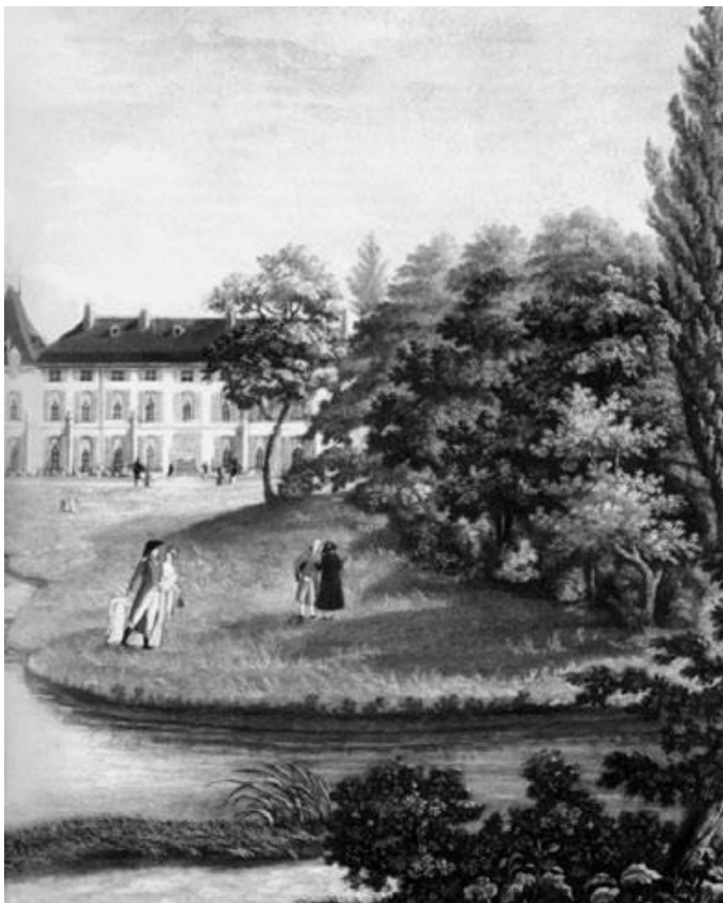
Вид Мальмезона с прогуливающимися Наполеоном и Жозефиной

Узнав об участии Наполеона, Жозефина попросила у государей-победителей – императора Александра I, австрийского императора Франца и прусского короля Фридриха – Вильгельма – разрешения последовать за ним, но ей было галантно, хотя и твердо отказано ввиду ее почтенного возраста и хрупкого здоровья. Правда, это была единственная серьезная просьба Жозефины, которую государи не удовлетворили. Российский император, известный ценитель женского обаяния, был очарован бывшей императрицей, часто навещал ее в Мальмезоне и вел долгие разговоры. После данного в его честь бала Александр несколько часов прогуливался с Жозефиной по аллеям Мальмезона – эта прогулка стала последней. Слишком легко – по тогдашней моде – одетая, разгоряченная после бала Жозефина жестоко простудилась и через несколько дней скончалась. Как говорят, последними ее словами были: «Бонапарт. Эльба. Римский король...»