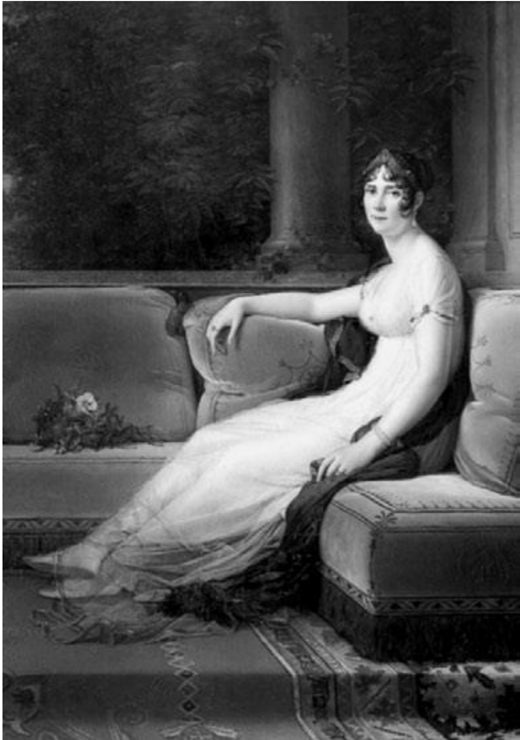
Франсуа Жерар. Императрица Жозефина, 1801 г.

Однако на мысли о бывших невестах нет времени. Разлука с обожаемой женой съедает Наполеона изнутри, заставляя с удвоенной силой бросаться на врага. За две недели он одержал девять побед, а между боями писал ей страстные письма, призывая не забывать, помнить, приехать к нему: «Когда я бываю готов проклясть жизнь, я кладу руку на сердце: там твой портрет, я на него смотрю, и любовь для меня – безмерное лучезарное счастье, омрачаемое только разлукой с тобой. Ты приедешь, правда? Ты будешь здесь, около меня, в моих объятиях! Лети на крыльях! Приезжай, приезжай!»