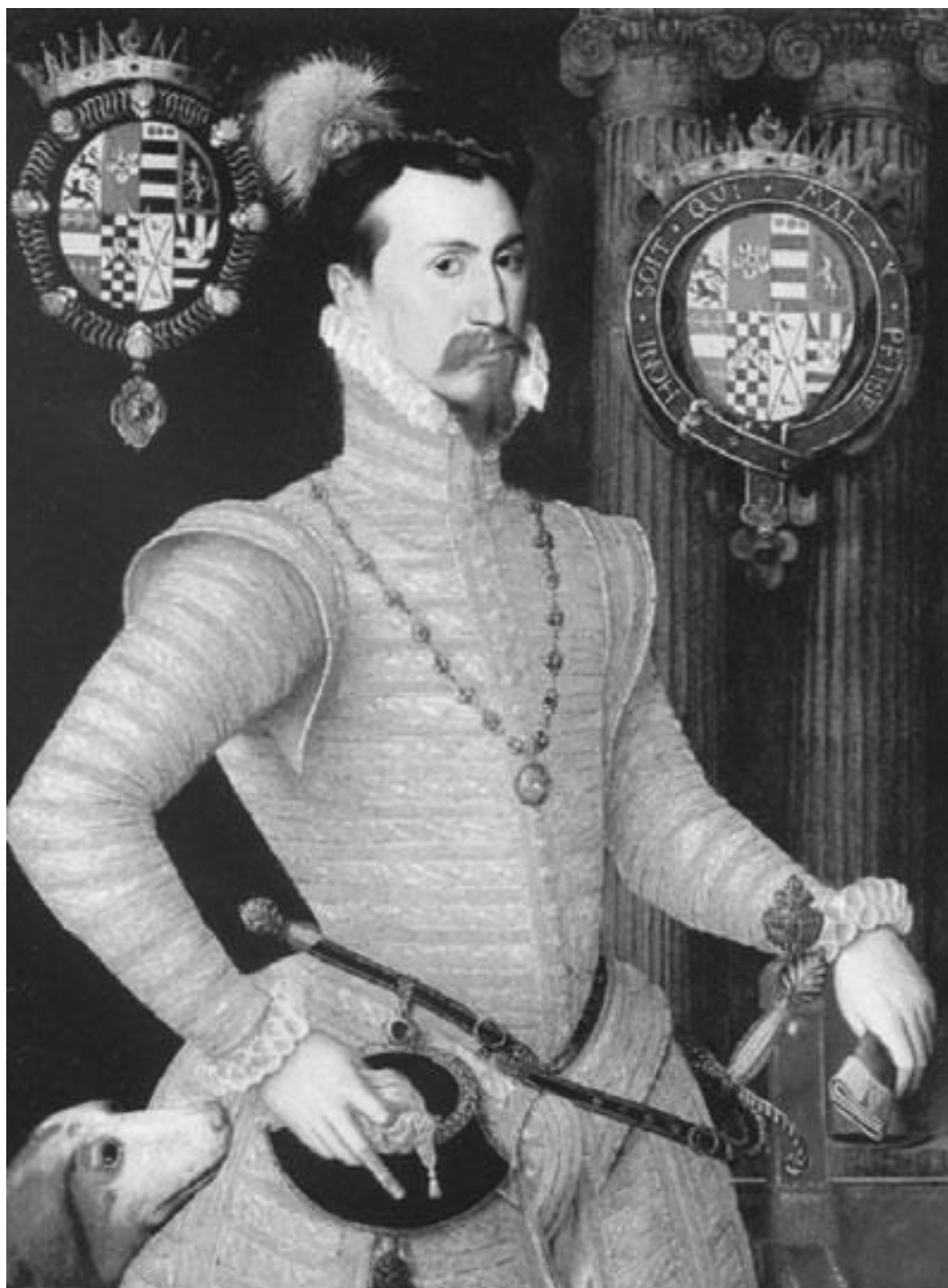
Роберт Дадли, 1 – й граф Лестер

Елизавета немедленно отдала его от себя и повелела тщательно расследовать обстоятельства гибели Эми Робсарт: хотя расследование показало, что смерть Эми произошла в результате несчастного случая – Эми была давно больна (современные исследователи говорят о раке), и в частности страдала головокружениями и хрупкостью костей, – это не остановило сплетников, обвиняющих Да дли в гибели жены. Из-за этой трагической истории королева отдала от себя бывшего фаворита и даже отказалась подписывать грамоту на вроде бы обещанный ему титул графа. Однако через два года, когда Елизавета заболела оспой, она назвала Роберта Дадли в качестве лорда-протектора королевства, хотя по статусу эта должность должна