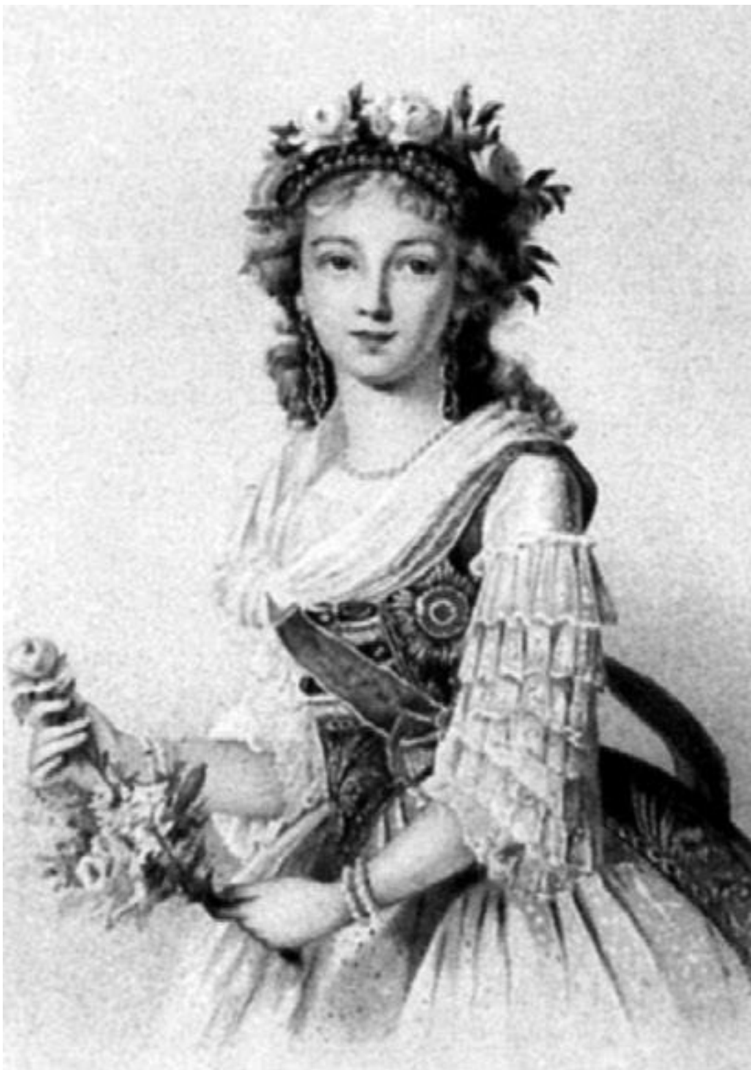
Акварель по портрету М.-Л.-Е. Виже-Лебрэн, 1795 г.

От лица его веет силой и грацией, радушием и таинственностью». Юная пара проводила много времени вместе, гуляя и беседуя на возвышенные, как тогда полагалось, темы – впрочем, под бдительным присмотром свиты. Александр писал Луизе: «Мой милый друг. Я буду Вас любить всю жизнь», и в ответ получал: «Я тоже люблю Вас всем сердцем и буду любить Вас всю мою жизнь. Вы составите счастье моей жизни, если будете меня любить всегда, я не могу жить без вашей дружбы. Ваша преданнейшая и покорнейшая суженая Луиза». Мария Федо-