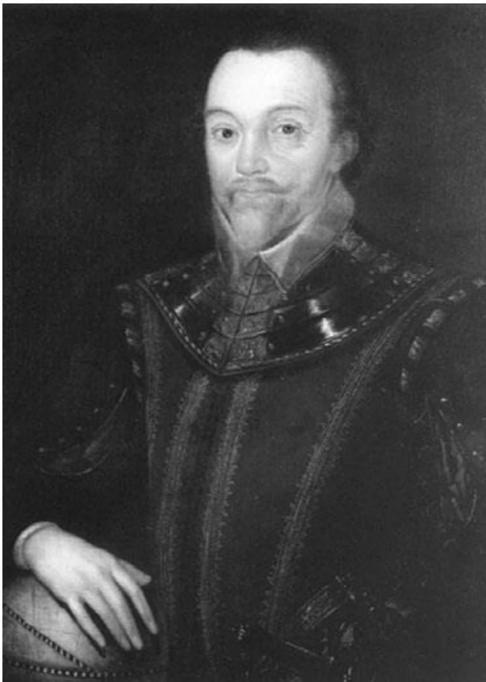
Френсис Дрейк, картина Маркуса Жерара младшего, 1590 г. или старше