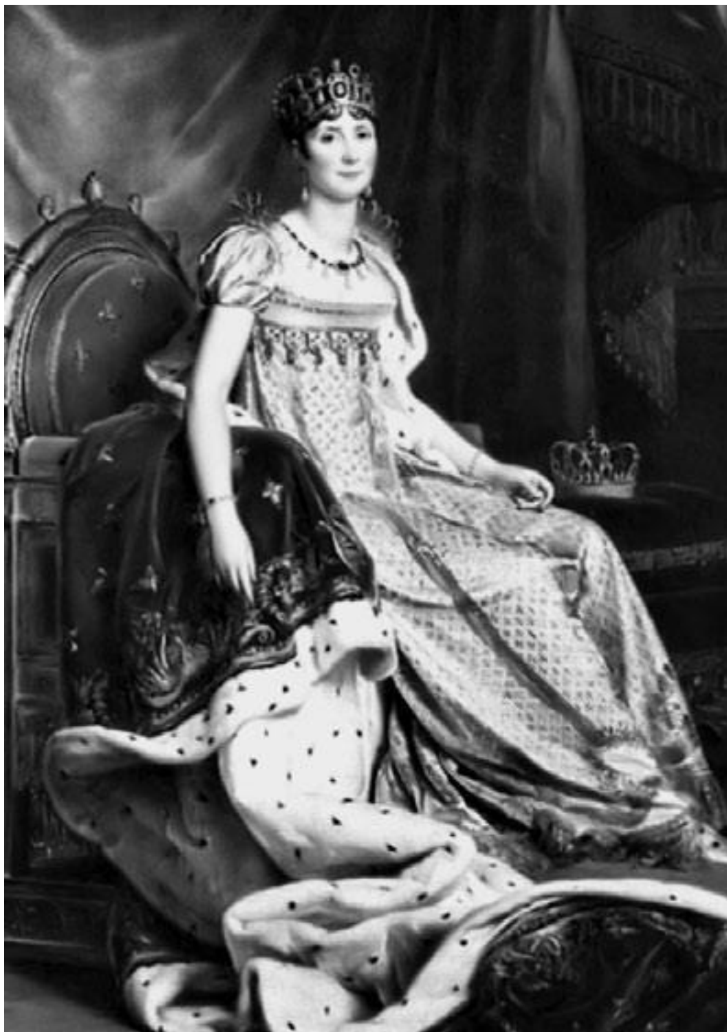
Франсуа Жерар. Портрет императрицы Жозефины в коронационном платье, 1808 г.

Говорят, Наполеону так понравилась коронованная Жозефина, что в тот вечер она по его желанию даже ужинала в короне – весьма, кстати, тяжелой. В этом видят полный скрытого смысла символ – быть супругой императора было весьма непросто... Но Жозефина справлялась с новой ролью с подлинным блеском, став истинной императрицей, матерью нации и образцом для подражания для всех своих подданных. Было известно, что она принимает ванну каждое утро – и во всех домах стали устраивать ваннские комнаты, а блистающие чистотой дамы перестали маскировать запах грязного тела ведрами одеколona. Ее прически повторяются на