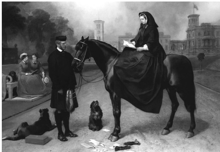
Эдвин Ленсдир. Королева Виктория в Осборне, 1866 г. Поводья лошади держит Джон Браун, на скамейке сидят принцессы Хелена и Луиза

Виктория стала снова появляться на публике лишь в 1871 году: после того, как ее старший сын и наследник успешно перенес тяжелый тиф, по всей стране прошли благодарственные торжества, в один миг вернувшие королевской семье былую популярность, а Виктории – искреннюю любовь подданных.