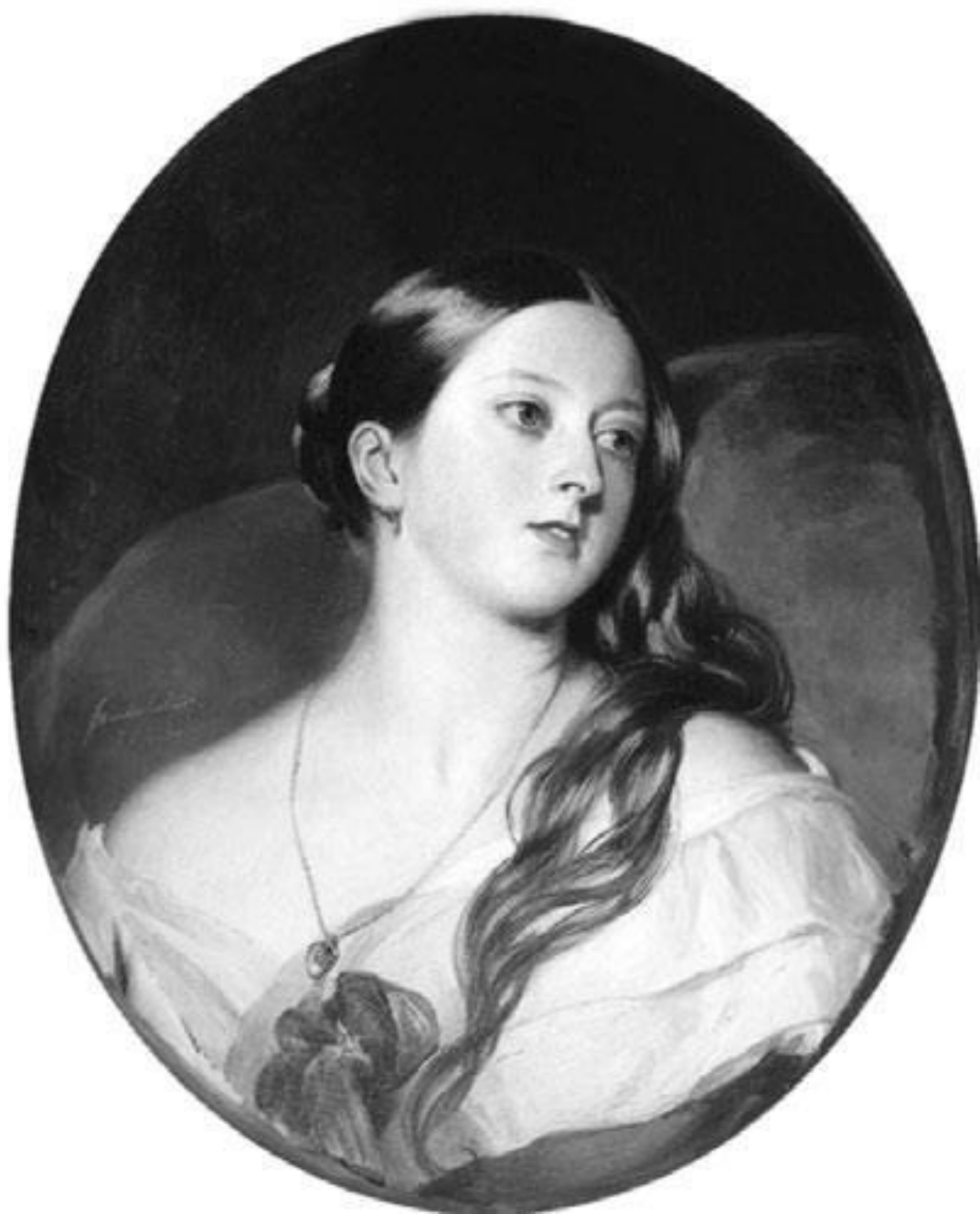
Франц Ксавье Виктерхальтер. Королева Виктория, 1843 г.

Виктория и Альберт в сопровождении своих детей постоянно показывались на публике, являя собой лучший пример «настоящей семьи». Их образ жизни (по крайней мере тот, каким его изображала пресса) стал образцом для всех подданных. С легкой руки принца Альберта, привезшего из родной Германии обычай праздновать Рождество в кругу семьи – с елкой, индейкой и обязательными подарками для прислуги – такое обыкновение распространилось по всей Англии, а затем и в английских колониях. Виктория любила Ирландию и часто там бывала – и ее любимый городок Килларни превратился в процветающий курорт. По примеру королевы, которая обзавелась загородным домом – сначала поместьем Осборн на острове Уайт, а затем замком Бальморал в Шотландии, состоятельные англичане тоже стали покупать себе сельские коттеджи, где, подобно принцу Альберту, собственноручно копались в земле. Королева Виктория использовала во время родов принца Леопольда хлороформ – и на анестезию во время родов перестали смотреть как на нарушение библейской заповеди. В 1845 году, когда в