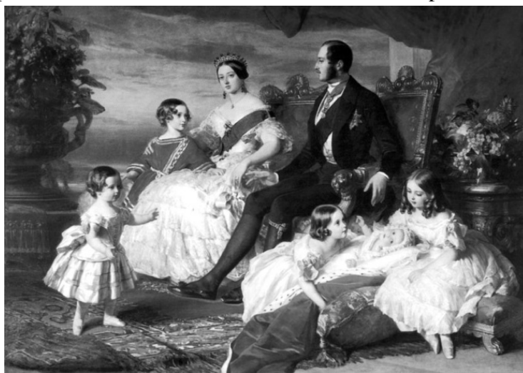
Франц Ксавье Винтерхаптер. Портрет королевы Виктории и принца Альберта с детьми

Идеальная семья Виктории и Альберта не только подняла на недостижимую прежде высоту престиж английской королевской семьи, но и повысила в общественном сознании статус личной, частной жизни: из формального института, где супругов связывали скорее деловые отношения, чем чувства, семья превратилась в ту самую ячейку общества, обладающую первостепенным для государства значением, где любовь ценилась и приветствовалась (правда, сексуальную сторону брака было принято не только скрывать, но даже отрицать). Хотя сама королева была явно не чужда плотских радостей: когда измученной постоянными родами Виктории врачи деликатно посоветовали единственное на тот момент действенное средство контрацепции – воздержание, она отказалась: «Может быть, это и вредно, но зато как приятно!»