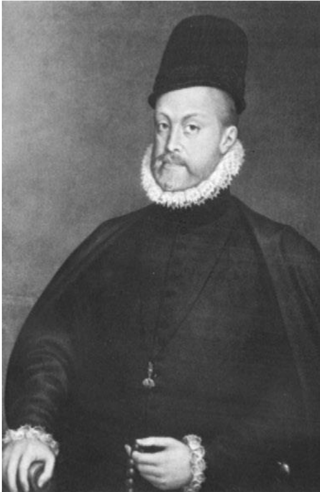
Портрет Филиппа II снетками, Алонсо Санчес Коэльо, 1573 г.

Поначалу отношения между сестрами были вполне равными; однако Елизавета не хотела переходить в католицизм, как на том настаивала Мария. Это можно понять: по мнению католической церкви, брак Генриха с ее матерью был незаконным, и следовательно Елизавета была незаконнорожденной. Юная принцесса старалась, как могла, ладить со своей венценосной сестрой – однако той слишком многие говорили, что Елизавета очень опасна. Мария долго