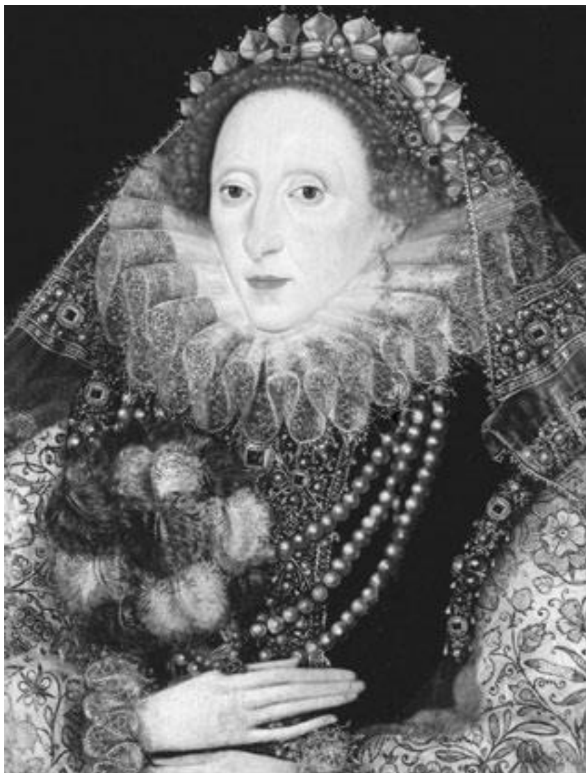
Елизавета I Тюдор с веером, портрет неизвестного, 1585 г