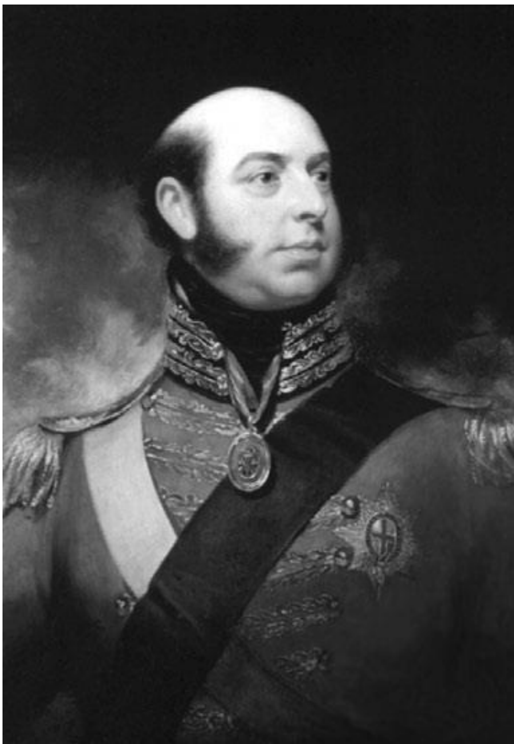
Уильям Бичи. Эдвард, герцог Кентский

Детство будущей королевы было совсем не королевским: в доме царила строжайшая экономия, так что у девочки не было игрушек, пища была очень простая, а новое платье она получала лишь тогда, когда полностью износится старое, – даже став королевой, Виктория была уверена, что все дамы, без конца меняющие туалеты, безнравственные мотовки. Рассказывают, что когда Виктория совершила свой первый визит во Францию, ее наряды были куплены у лавочника в Кале, в то время как французская императрица Евгения щеголяла в туалетах от Чарльза Ворта – англичанина, перебравшегося в Париж из-за недостатка клиенток.