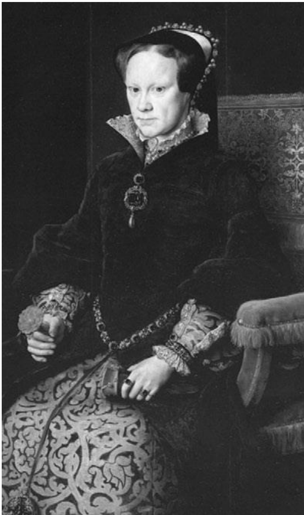
Мария Тюдор (Мария Кровавая или Кровавая Мэри, ант. Bloody Mary), 1554 г.