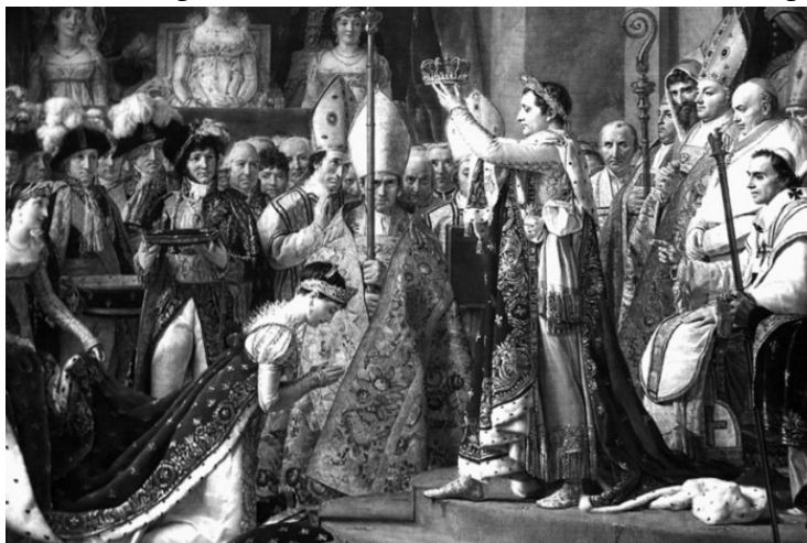
Жак-Луи Давид. Коронация Наполеона (фрагмент), 1805–1808 гг.

Семье, которая была категорически против коронования Жозефины (помимо личной неприязни к его супруге, братьев беспокоил еще один момент: если Жозефина будет коронована, дети ее дочери Ортанс, вышедшей замуж за младшего брата Наполеона Луи Бонапарта, как внуки императрицы окажутся выше по положению прочих его племянников), Наполеон ответил: «Я знаю ее – если бы я оказался не на троне, а в тюрьме, она разделила бы и мои несчастья. Так что она должна разделить со мной величие, это только справедливо».