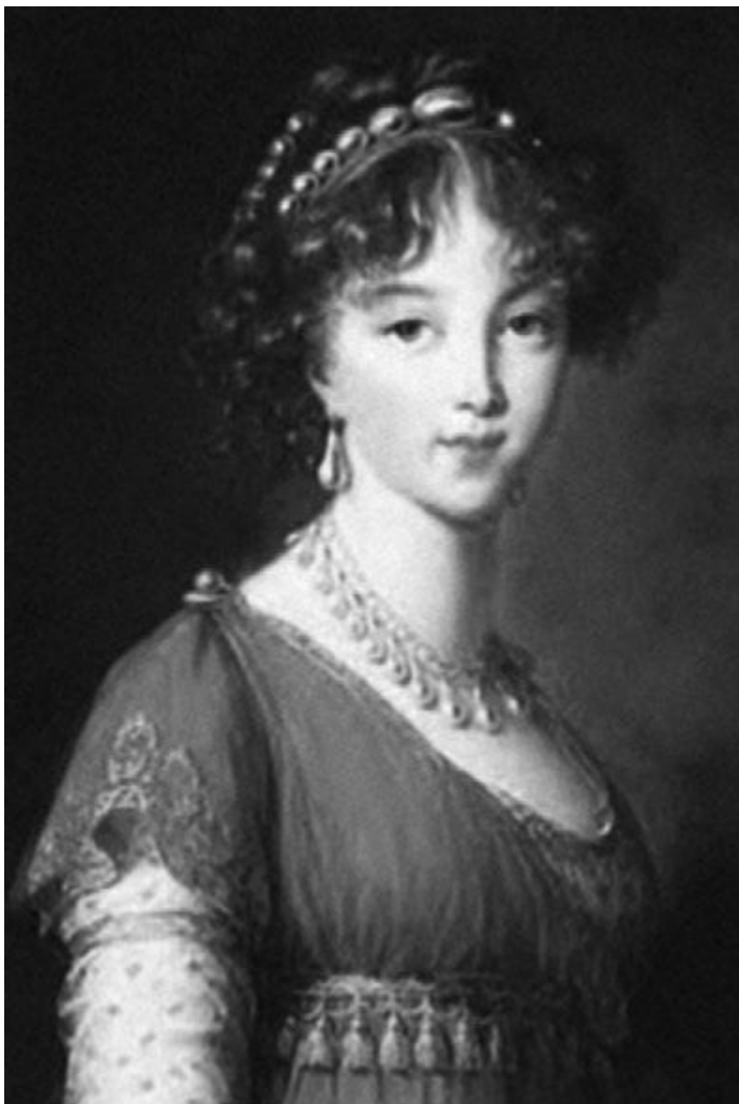
М.-Л.-Е. Виже-Лебрен. Портрет Великой княгини Елизаветы Алексеевны

После свадьбы Александр и Елизавета закружились в вихре приемов, игр и удовольствий, полностью соответствующих возрасту этой семейной пары: бегали наперегонки, лазали в окна, объедались сладостями, танцевали и охотились. Уже в первые дни стало понятно, что Елизавета обожает Александра: «Счастье моей жизни в его руках, если он перестанет меня любить, то я буду несчастной навсегда. Я перенесу все, все, но только не это», – писала она в письме. Сам великий князь к жене относился с любовью, нежностью, уважением – но любовь и ува-