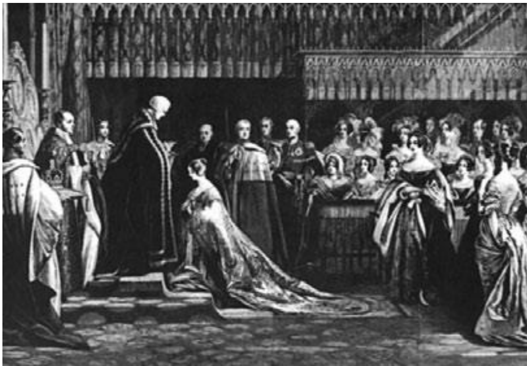
Коронация Виктории. По картине Ф.К. Винтерхальтера

Венчание Виктории и Альберта состоялось 10 февраля 1840 года. Виктория была в белом атласном платье, сшитом – из патриотических соображений – только из английских тканей, с венком из флердоранжа на голове. С тех самых пор свадебные платья, которые ранее могли быть практически любого цвета, надолго стали исключительно белыми.