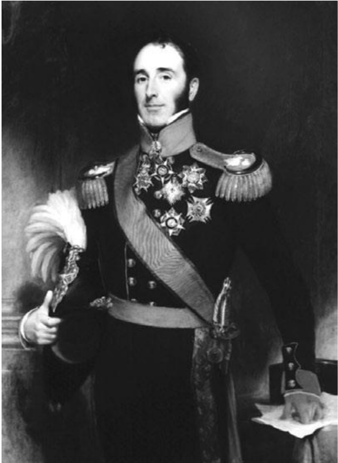
Генри Уильям Пикерсгилл. Сэр Джон Конрой

Ее собственные качества – сдержанность эмоций, прагматизм, высокие моральные принципы и преданность интересам государства, служили образцом для всех британцев. К своей стране Виктория относилась как к дому, где она была рачительной хозяйкой, а к подданным – как к семье, для которой она стала любящей матерью. Частые поездки по стране не только позволили хорошо узнать жизнь своих подданных, но и обеспечили ей популярность в народе, а ее безупречный образ жизни и личное обаяние сделали королеву любимицей страны.