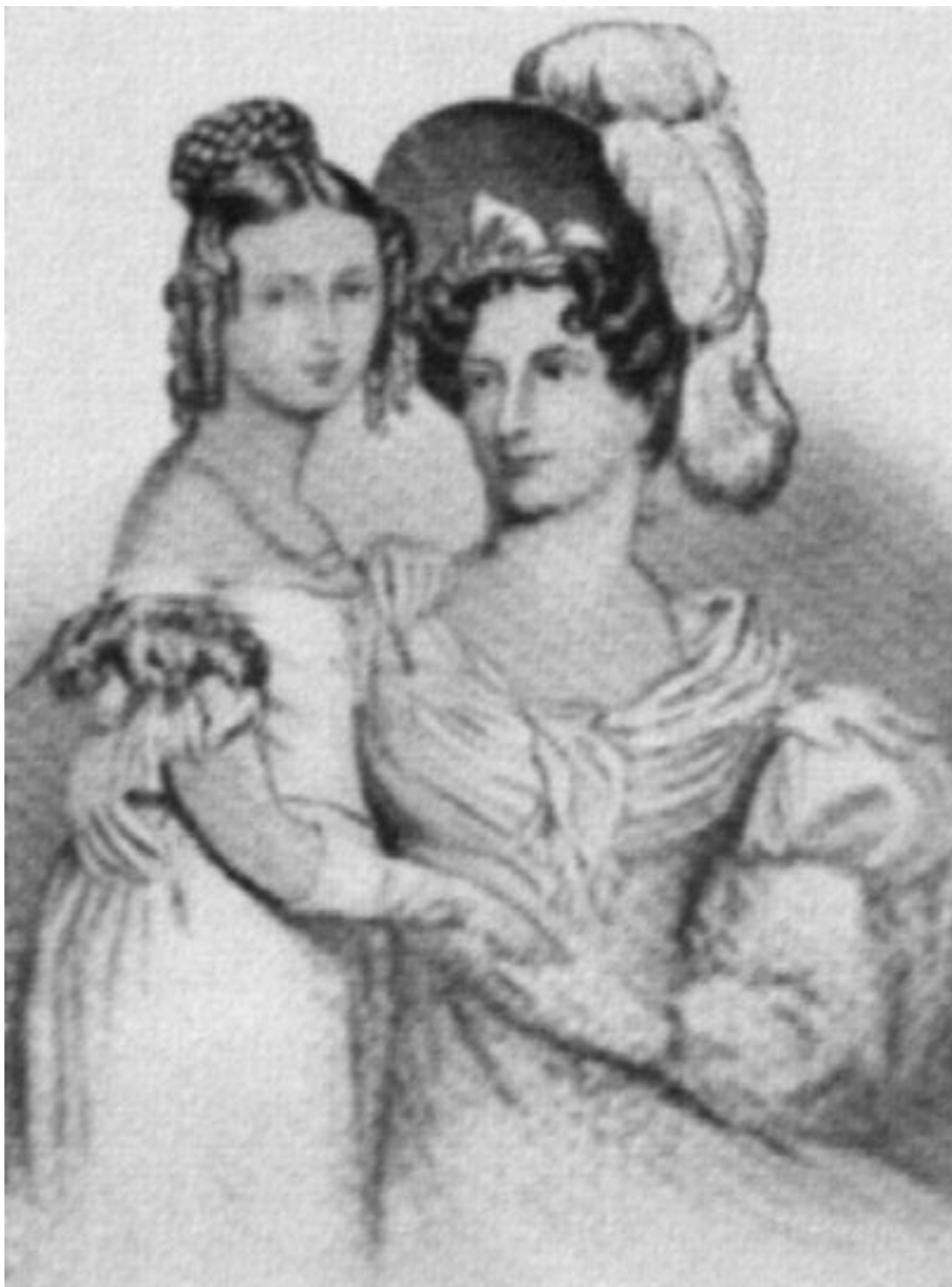
Герцогиня Кентская с дочерью, 1834 г.