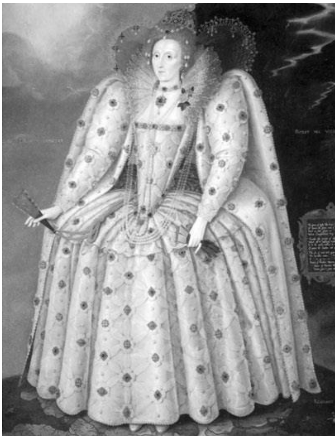
Елизавета I, «Портрет Дитчли», ок. 1592 г Маркус Гираэрт Младший

Стареющая королева оставалась все той же кокеткой, которой была в юности, – с поправкой на власть и возраст. Если раньше она принимала лесть, теперь она ее требовала, если раньше она соперничала с придворными красавицами – теперь во фрейлины набирали лишь некрасивых дам, и платья им разрешалось носить только простые белые или серебристые – в то время как сама Елизавета ходила в богато разукрашенных нарядах всех цветов радуги. Ее прежняя бережливость переросла в скупость, а осторожность – в бездействие. Тем не менее королева сохраняла ясный и острый ум, работоспособность и прежние привычки. Вместо умершего Роберта Дадли королева стала отличать его пасынка, сына Петиции Ноллис от первого брака, Роберта Девере, графа Эссекса, женатого, кстати, на вдове знаменитого поэта Филиппа Сидни. Молодой красавец – а ему было всего 23 года, когда королеве уже исполнилось 55