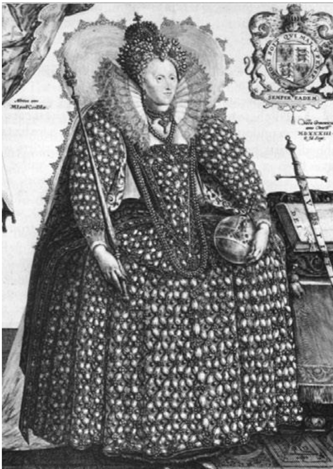
Гравюра Елизаветы I, Криспена де Пасса, опубликована в 1603 году