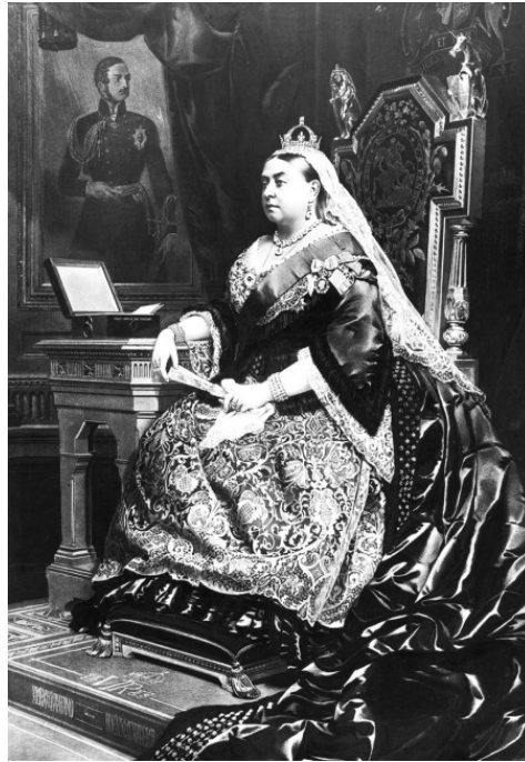
Королева Виктория, 1882 г. На стене – портрет принца Альберта работы Ф. Винтерхальтера

Согласно завещанию, в гроб к королеве положили слепок руки принца Альберта и его халат, а по другую руку – портрет Джона Брауна и прядь его волос. Она была одета в белое платье – именно в нем она собиралась вновь встретиться со своим «милым ангелом» Альбертом. Ее похоронили рядом с ним в мавзолее Фрогмор в Виндзорском замке. Вместе с нею англичане похоронили девятнадцатый век – век спокойствия, стабильности и викторианских ценностей.