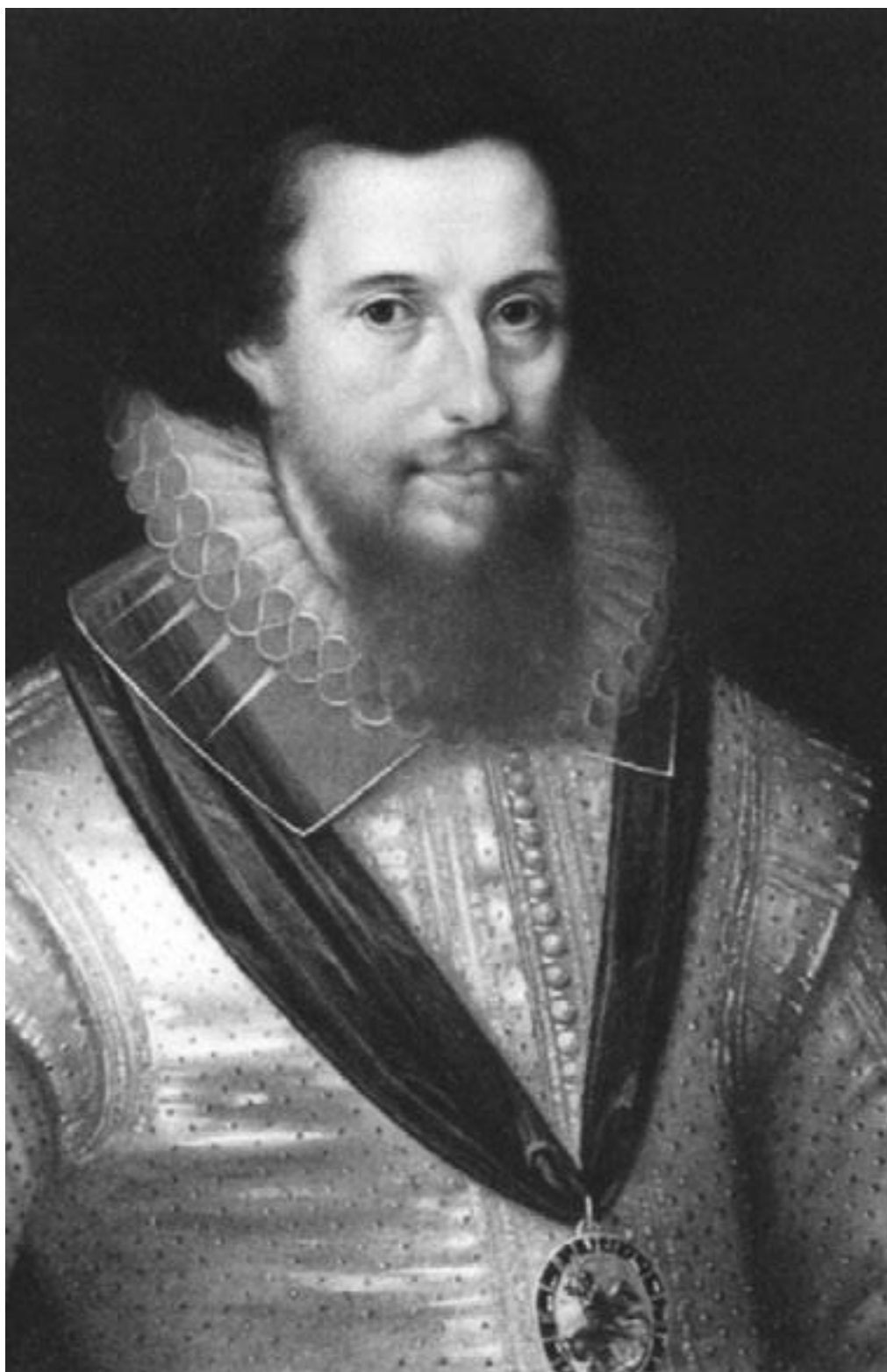
Роберт Девере, 2-й граф Эссекс

Королева очень тяжело перенесла и предательство Эссекса, и его казнь. Она так и не оправилась от этой потери: ее здоровье резко ухудшилось, и к тому же у нее начались приступы душевного расстройства, во время которых она лишь плакала и звала Эссекса. Она понимала, что ее дни сочтены – в упрек придворным, почти переставшим считаться с нею, она повторяла: «Мертва, но еще не погребена!» В своей последней речи, которую она произнесла перед парламентом в октябре 1601 года, она сказала: «На том месте, что я сейчас занимаю, никогда не