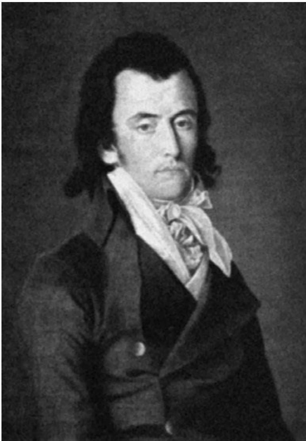
Неизвестный художник. Виконт Александр Богарне, начало 1790-х гг.

Там она провела два года – все так же веселясь, флиртуя и соблазняя. Один из офицеров вспоминал Мари-Роз того времени: «Эта дама, которую нельзя назвать красивой, тем не менее очень привлекательна своим стилем, веселостью и добросердечием. Она открыто пренебрегает общественным мнением. Поскольку ее доходы весьма ограничены, а она обожает тратить деньги, она вынуждена заимствовать их из кошельков своих поклонников».