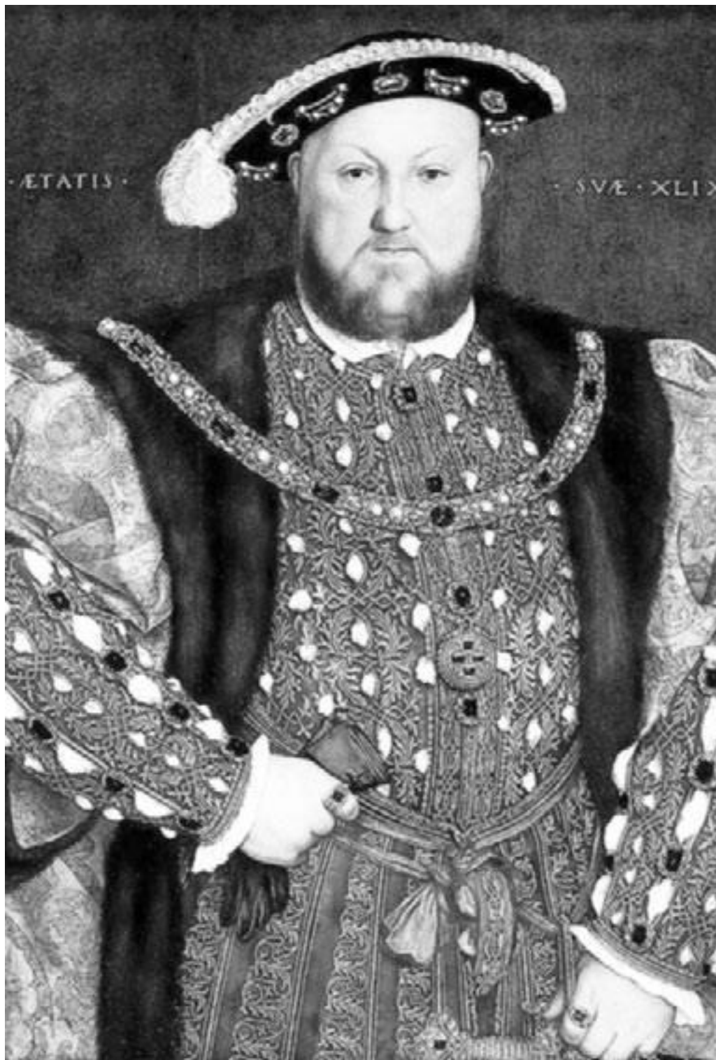
Генрих VIII, отец Елизаветы I. Портрет кисти Ганса Гобейна младшего, 1539–1540 г.

Король Генрих Восьмой скончался 28 января 1547 года. Согласно его завещанию, дочери были признаны наследницами престола вслед за своим братом Эдуардом, отныне королем Эдуардом Шестым. Таким образом, они были официально признаны отцом. Через несколько месяцев Катерина Парр вышла замуж за Томаса Сеймура и переехала в его поместье в Челси. Вместе с любимой мачехой поселилась и Елизавета.