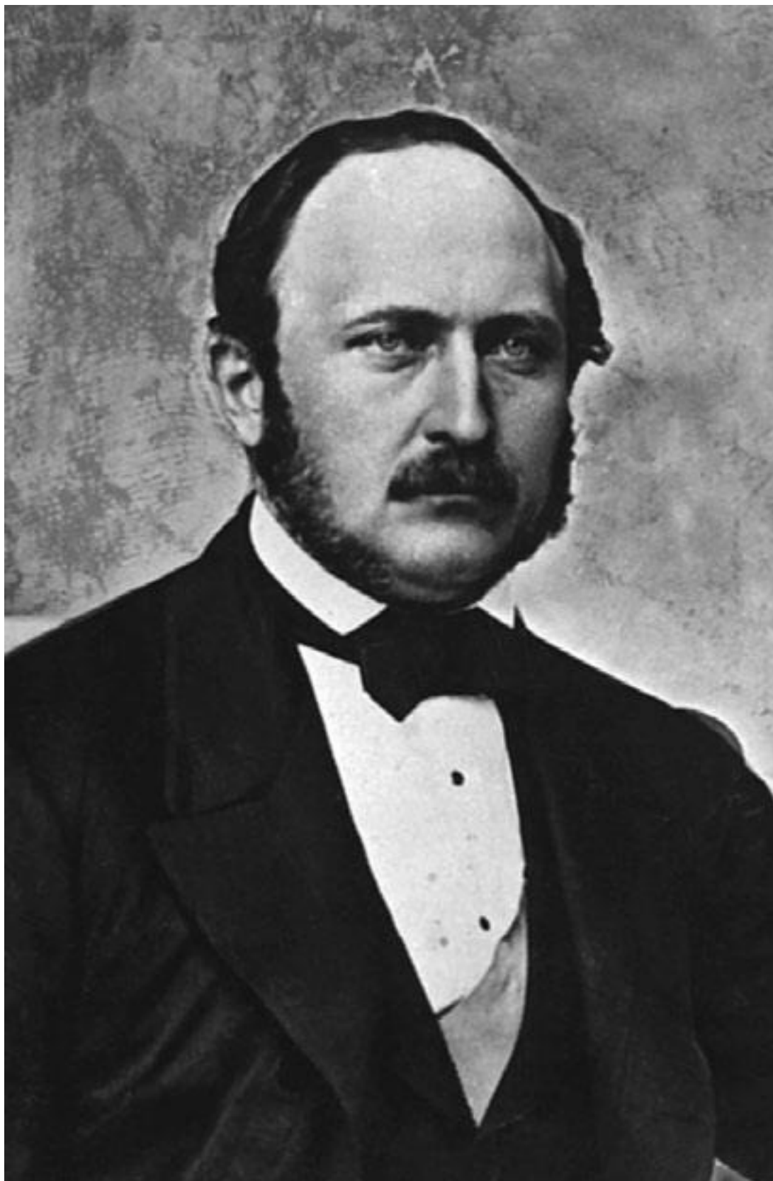
Принц Альберт, конец 1850-х гг.

Несколько лет королева практически не появлялась на публике – в конце концов это привело к тому, что англичане, ранее обожавшие свою королеву, и искренне сочувствующие ей в ее горе, стали критиковать Викторию за пренебрежение своими основными обязанностями –