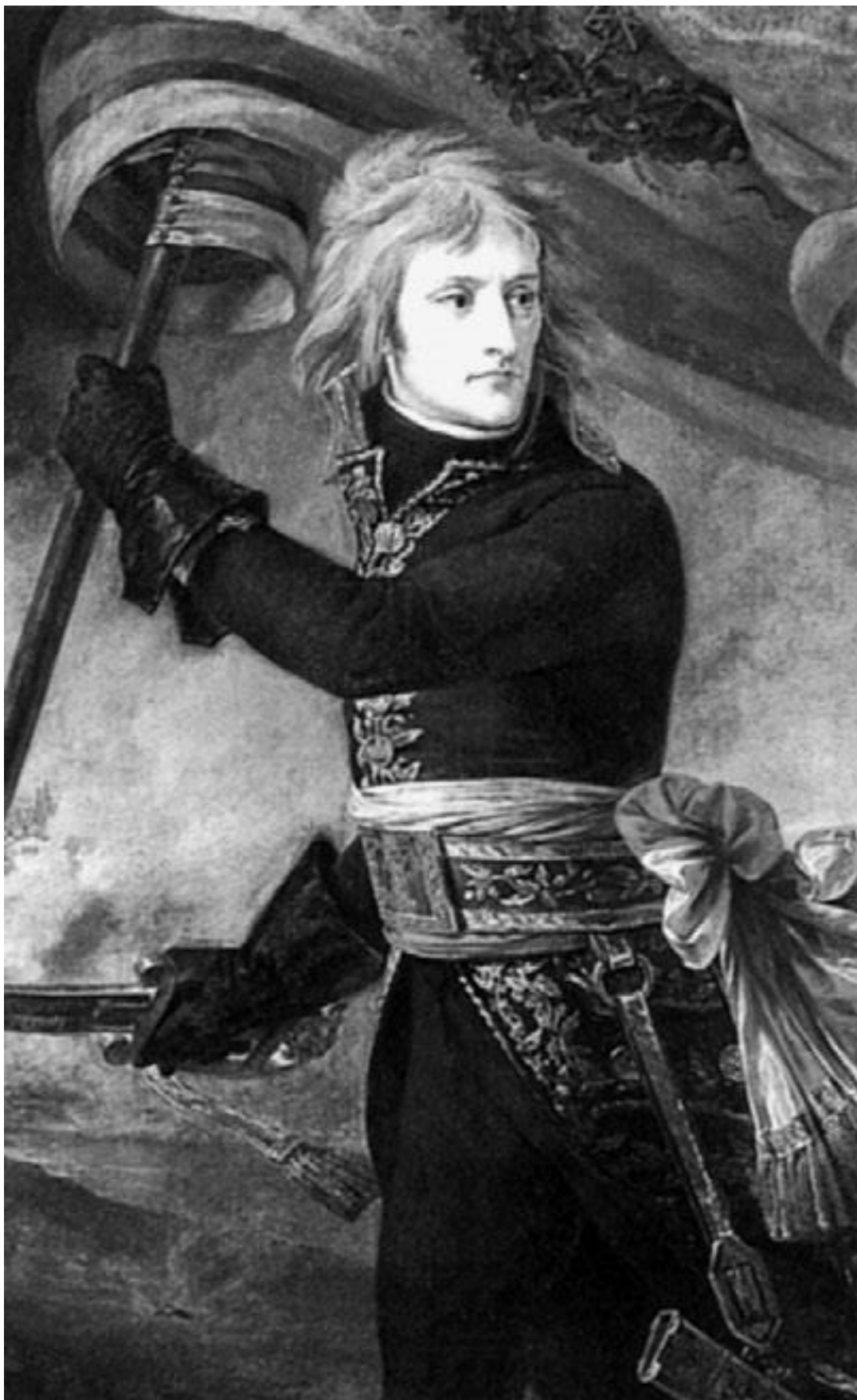
Жан-Антуан Гро. Наполеон на Аркольском мосту, 1801 г