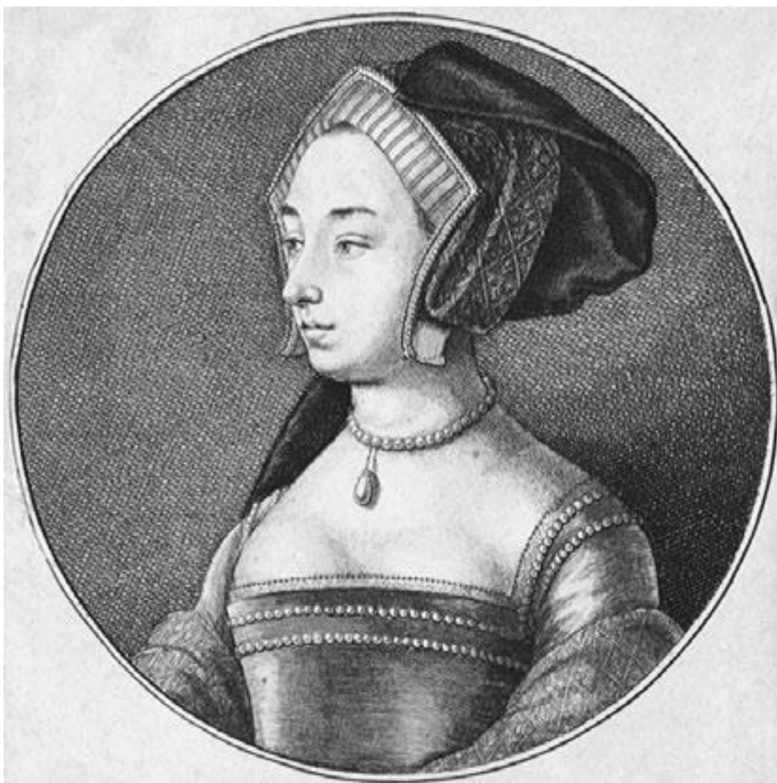
Анна Болейн, мать Елизаветы I. Портрет кисти Вацлава Холлара.

В январе 1533 года Генрих втайне женился на своей давней возлюбленной Анне Болейн, которая на тот момент была беременна. По одной из легенд, придворный астролог предсказал Генриху, что первый ребенок от Анны станет великим правителем. Увы, к жестокому разочарованию короля, на свет появилась дочь – Елизавета, получившая свое имя в честь матери Генриха. Астролога приказали казнить; больше у Анны детей не было.