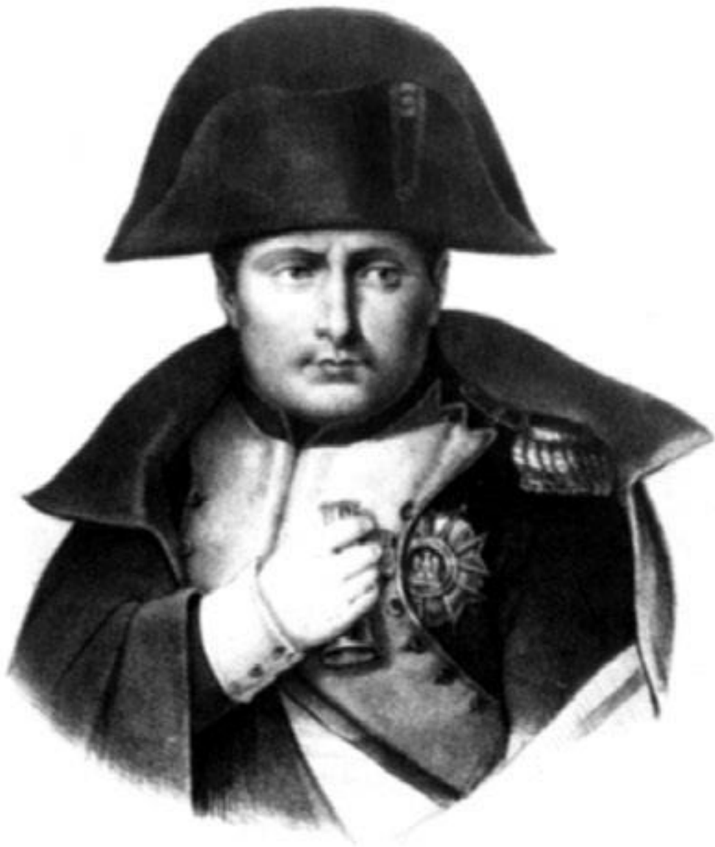
Наполеон Бонапарт, ок. 1810 г.