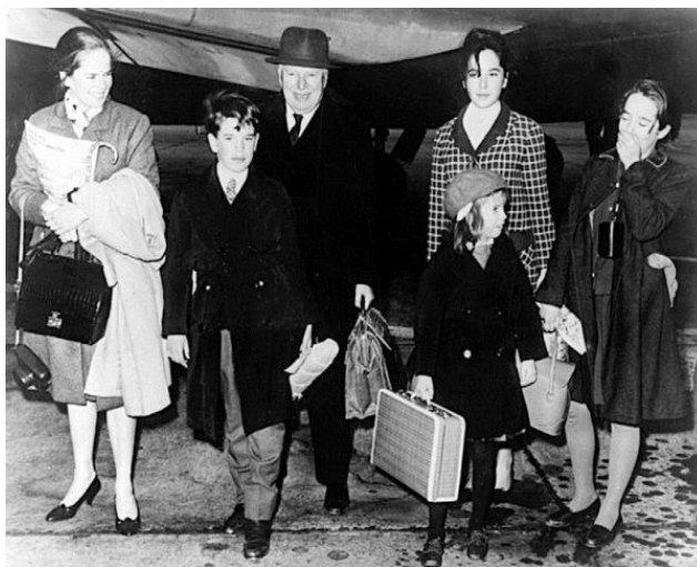
Чарльз Чаплин и Уна с детьми.

Оскорбленный Чаплин поселился с семьей в Швейцарии – он купил дом в маленьком городке Корсье-сюр-Ве́ве. Они с Уной жили на редкость счастливо – сбылось пророчество гадалки, предсказавшей когда-то Чаплину успех в кино и удачный брак на склоне лет. Уна была ему идеальной женой: «Он помогал мне взрослеть, а я помогала ему оставаться молодым», – признавалась она. У нее и Чарли было восемь детей – младшего, Кристофера Джеймса, она родила, когда Чаплину было 72 года. В Швейцарии Чаплин общался с друзьями – среди них была королева Испании, кинозвезды и литераторы, писал музыку к своим старым фильмам и был счастлив.