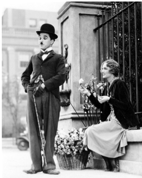
Чарльз Чаплин и Вирджиния Черрилл в фильме «Огни большого города», 1931 г.

убить во время встречи с премьер-министром, дабы таким образом развязать войну с Америкой, однако в последний момент планы заговорщиков поменялись, и премьер-министра убили накануне его запланированной встречи с Чаплином.