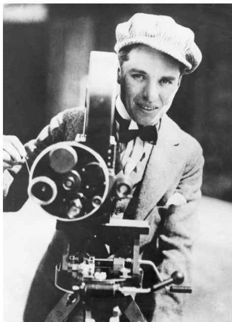
На съемочной площадке Чаплин легко менял свое амплу.