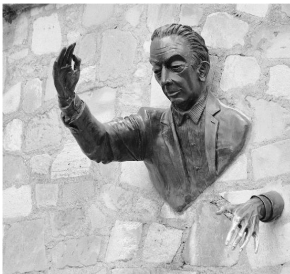
Жан Маре. Памятник Марселю Эме.

Друзья говорили, что Маре до конца своих дней оставался ребенком, и всю жизнь прожил играя. Он писал своему другу, поэту Роберу Лабади: «Я делаю скульптуры не потому, что я скульптор, рисую не потому, что я художник, пишу не потому, что я писатель. Я только развлекаюсь, и вы это знаете. Снимите ваши искажающие очки. Я даже не знаю, являюсь ли я настоящим актером». До последних дней Маре был уверен, что все его удачи – «череда счастливых несправедливостей». «Мне никогда ничего не доставалось от жизни, кроме самого лучшего, – говорил он. – Это несправедливо».