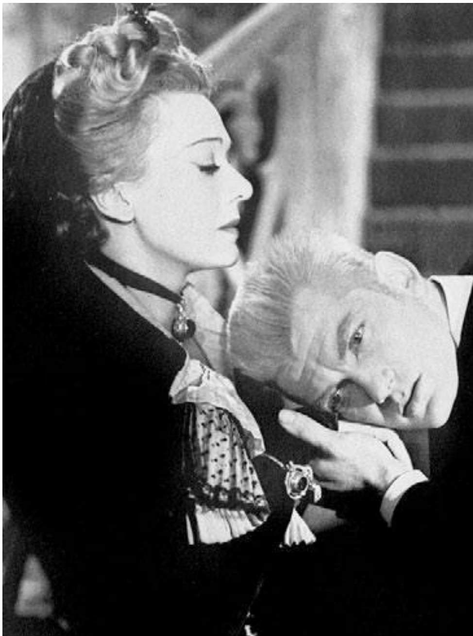
Жан Маре и Эдвиж Ферье в фильме «Двуглавый орел», 1947 г.

французским специалистом по парикам (а отирать ее приходилось чуть ли не с кожей), и по часу уходило на каждую руку, а кроме этого специальной краской красили зубы и накладывали звериные клыки. Кожа под гримом ужасно чесалась, к тому же, из страха, что грим может отклеиться, Маре на съемках питался исключительно компотами и пюре. В то же время у Кокто тоже началось кожное заболевание – по мнению некоторых, это было проявлением его любви к Маре. На съемочной площадке ему приходилось работать, закрыв лицо листом бумаги с прорезями для глаз, который Кокто крепил скрепками к шляпе.