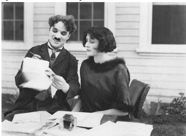
Чаплин и Лита Грей изучают сценарий фильма «Золотая лихорадка».

Во время съемок первого фильма для United Artists — «Золотой лихорадки» – тридцатипятилетний Чаплин все же женился. Его супругой стала юная – на момент свадьбы ей едва исполнилось шестнадцать лет – начинающая актриса Лита Грей (настоящее имя Лиллита Луиза МакМюррей), а причиной свадьбы снова была беременность невесты. Лита очень удачно сыграла одну из главных ролей в «Малыше» и была приглашена в «Золотую лихорадку», а заодно и в постель Чаплина. По слухам, когда выяснилось, что Лита ждет ребенка, Чаплин сначала предлагал ей оплатить аборт, а затем обещал чек на немаленькую сумму, если она выйдет замуж за другого, однако Лита отказалась. Под угрозой судебного иска – по закону Лита была еще несовершеннолетней – Чаплину пришлось-таки жениться на ней: свадьба состоялась в Мексике под покровом тайны 24 ноября 1924 года. Через пять месяцев Лита родила сына Чарльза Спенсера-младшего, а еще через год – Сиднея Эрла. Однако настоящей семьи снова не получилось.