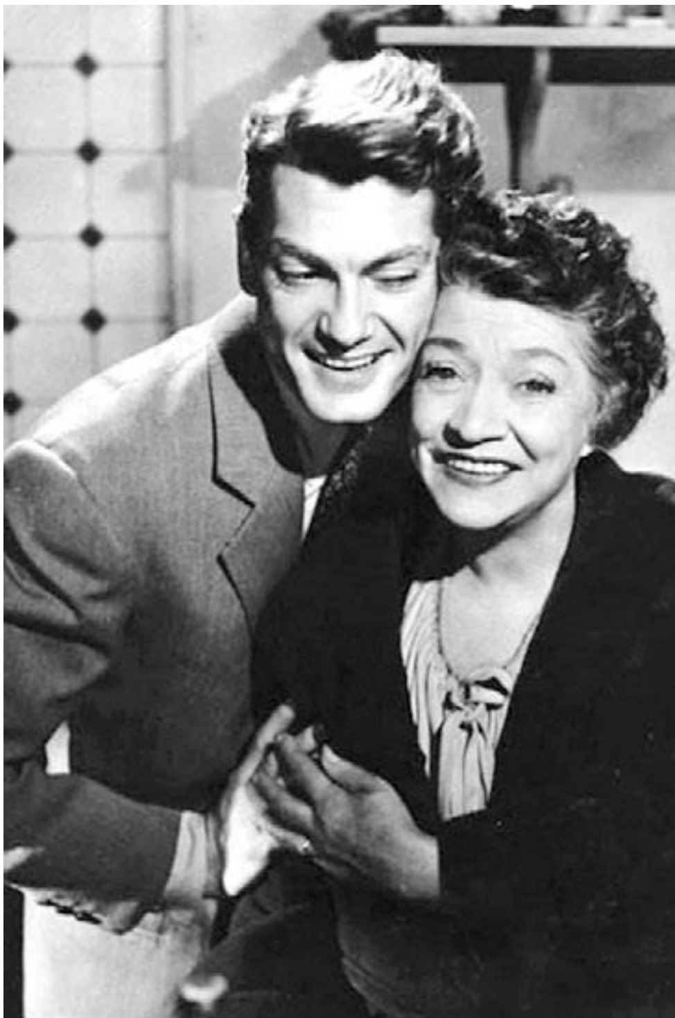
Жан Маре и Ивонн де Бре в фильме «Ужасные родители», 1948 г.

Спектакль готовился с большими трудностями, однако, когда он наконец вышел, его ждал неожиданно шумный успех, а Маре – восторженные рецензии в газетах и любовь зрителей. «После триумфальной премьеры «Родителей» настоящая радость входит в мою жизнь, – писал Маре. – Каждый вечер я шел в театр, как к любовнице. Я уходил оттуда, как уходят от нее, – блаженствуя и исчерпав себя до дна. Критики единодушно хвалили меня, пьесу, моих товарищей».