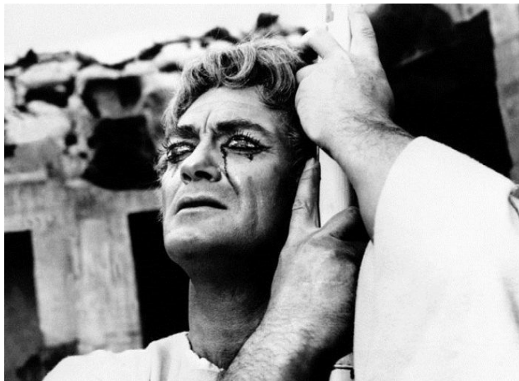
Жан Маре в фильме «Завещание Орфея», 1960 г.