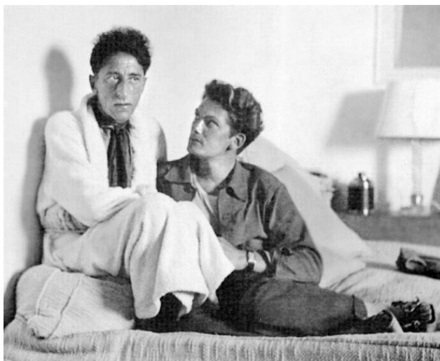
Жан Марэ и Жан Кокто.

В освещенной мягким, затененным светом комнате, где прихотливая фантазия хозяина соединила игрушечную лошадку и магический кристалл, эскизы Пикассо и китайскую опиумную трубку, мэтр в белом махровом халате и шелковом шарфе на шее напряженно всматривается в лицо молодого дилетанта – своего слушателя, – писал Марэ в воспоминаниях.