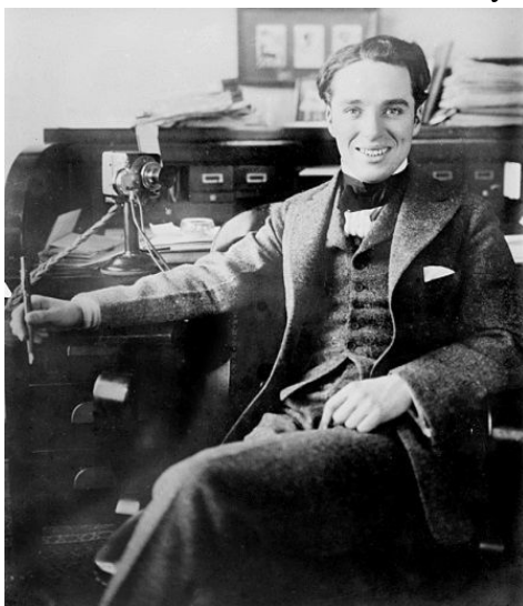
Чарльз Спенсер Чаплин в своем кабинете, начало 1910-х гг.

Одна из первых американских киностудий, Keystone снимала типичные «полицейские» комедии-экспромты с погонями и драками, и Чарли поначалу не очень вписывался в довольно примитивные фильмы Сеннета. Однако именно в них – в комедиях «Невероятно затруднительное положение Мэйбл» и «Детские автомобильные гонки» – в 1914 году родился тот самый Чарли, который станет на несколько десятилетий любимцем публики по обе стороны океана.