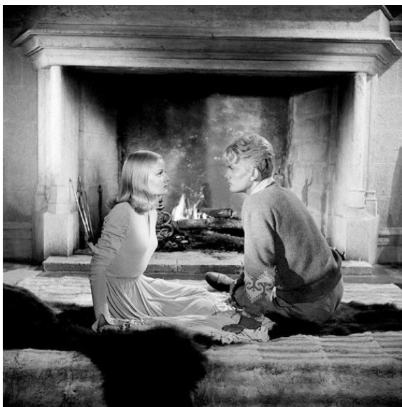
Жан Марэ и Мадлен Солон в фильме «Вечное возвращение», 1943 г.

На натурных съемках «Кровати» Марэ сблизился со своей партнершей Милой Парели, очаровательной и веселой девушкой: они изо всех сил старались держать свой роман в тайне, однако слухи о нем поползли довольно быстро, дойдя в конце концов и до Кокто. Однако тот, вместо сцен ревности, сделал Марэ поистине роскошный подарок – сценарий фильма «Вечное возвращение». В его основу легла старинная легенда о Тристане и Изольде и их несчастной любви, только действие развивалось в современной Франции. Тристан стал Патрисом, а Изольда – Натали, но их трагическая обреченная любовь по-прежнему трогала сердца.