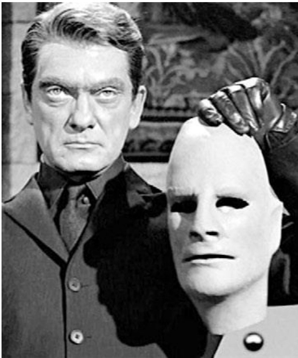
Жан Марэ в образе Фантомаса.

После смерти Кокто Марэ выполняет желание своего великого друга – ставит его последнюю пьесу «Ученик дьявола». Он снова играл, ставил, декорировал, шил костюмы... Спектакль не имел ожидаемого успеха, однако Марэ был счастлив хотя бы тем, что пьеса Кокто увидела свет. По признанию его друзей, вся его жизнь вращалась вокруг Кокто, он делал все в его честь и ради его памяти. Говорят, именно по совету Кокто Марэ начал сниматься в экранизации приключений Фантомаса – пародийном сериале по мотивам произведений Пьера Сувестра и Марселя Аллена. Успех этих фильмов был настолько предсказуем, что съемки второй и третьей частей начались еще до того, как был закончен монтаж первой. Марэ, исполнивший в трилогии роли самого Фантомаса, его протагониста журналиста Фандора и еще кучу ролей, стал невероятно популярен во всем мире и так возненавидел эти фильмы, что вместо запланированных изначально пяти картин было снято всего три. По иронии судьбы, фильмы про Фантомаса стали фактически концом карьеры Марэ в кино – с тех пор он появлялся на экране лишь эпизодически. «Мне не предлагали больше ничего, кроме приключенческих фильмов. Ловушка, которой я старательно избегал, захлопнулась. Я начал отказывать. А потом мне больше никто ничего уже не предлагал», – вспоминал Марэ. Последнюю крупную роль он сыграл в 1970 году в «Ослиной шкуре» Жака Деми.