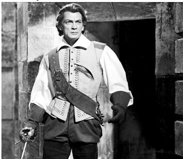
Жан Маре в фильме «Капитан», 1960 г.

дел, как он лихо повторил сложный трюк во время циркового выступления. Он признавался: «Обычно актеры, целиком состоящие из мускулов, не обладают психологической глубиной. Нельзя требовать от Геркулеса из Чинечиты, чтобы он был даровитым исполнителем. Но Маре – о, с ним я держал в руках редчайшую птицу». Фильмы Юнебея побили все рекорды по сборам, и до сих пор остаются невероятно популярными. Конечно, все трюки Маре исполнял сам, хотя дело никогда не обходилось без несчастных случаев: на съемках сцены из «Капитана», где герой Маре взбирается на высокую башню с помощью двух кинжалов, на одном из дублей он сорвался и упал с пятиметровой высоты. К счастью, обошлось без травм. Когда Маре спрашивали, как он готовит свои трюки, он отвечал: «Часто режиссеры приглашают каскадеров, чтобы исполнить тот или иной трюк.