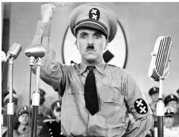
Чарли Чаплин в фильме «Великий диктатор», 1940 г.

Далеко не все были довольны картиной: одни обвиняли Чаплина в разжигании войны между США и Германией, другие говорили, что он слишком мягко отзывается о таком ужасном человеке. На него сыпались письма с угрозами и предупреждениями, «доброжелатели» обещали, что в кинотеатрах во время демонстрации фильма будут взрывать бомбы со слезоточивым газом или устроят стрельбу. Финальная речь, которую произносит в фильме принятый за Хинкеля цирюльник, вызвала наибольшие споры – в ней видели выражение политических взглядов самого Чаплина, явно не совпадающих с точкой зрения правящих кругов страны. Нью-йоркская газета Daily News даже писала, что Чаплин «тыкал в зрителей «коммунистическим пальцем». Деятельностью Чаплина заинтересовалась Комиссия по расследованию антиамериканской деятельности, а ФБР завело на Чаплина дело, которое к концу сороковых насчитывало более 1900 листов.