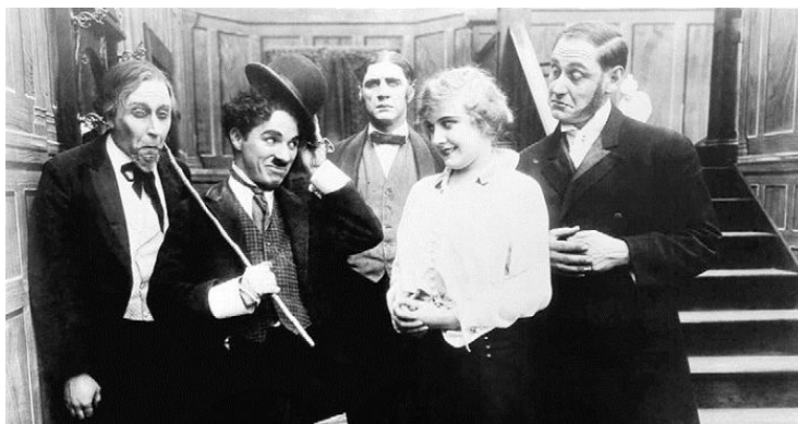
Чарли Чаплин и Эдна Первиэнс в фильме «Бегство в автомобиле», 1915 г.

Для Essenay Чаплин за год снял 12 фильмов – по одному в месяц. Звездой фильмов этого периода была Эдна Первиэнс – нашли ее, по рассказам очевидцев, совершенно случайно. Это сейчас каждую киностудию осаждают тысячи девушек, желающих сняться в кино, а тогда актрис приходилось искать самим студиям. Чаплин отсмотрел не один десяток актрис, хористок и танцовщиц, но так никого и не нашел. Наконец ему посоветовали заглянуть в одно кафе, где часто бывает очень хорошенькая девушка. Ею и оказалась Эдна, не только сыгравшая главные роли в нескольких лучших фильмах Чаплина, но и – на некоторое время – занявшая главное место в его сердце.