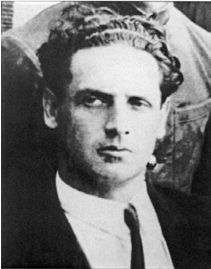
Роберто Бартини в начале своей карьеры авиаконструктора