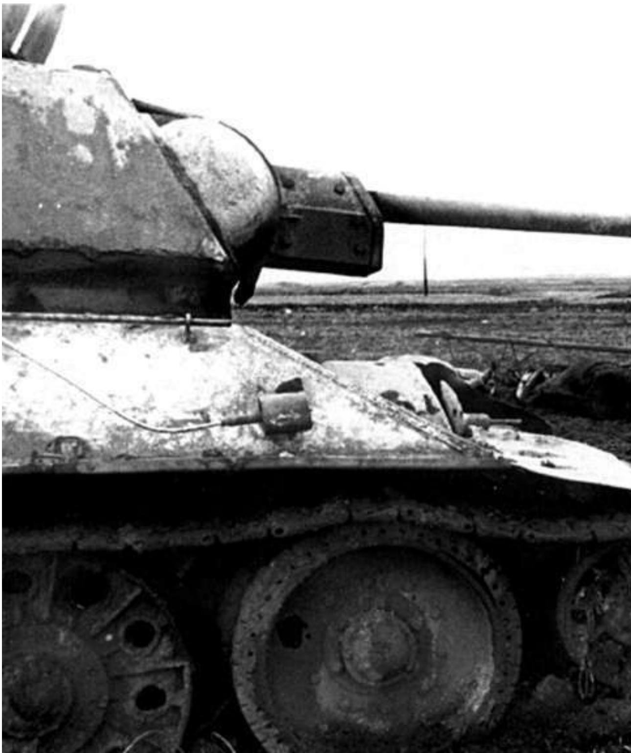
Подбитый в районе шоссе Москва – Минск под Оршей танк Т-34

С целью сломить сопротивление противника на новом рубеже командованием Западного фронта была предпринята перегруппировка войск. Находившаяся доселе южнее 21-й армии 33-я армия рокировалась вправо на оршанское направление в район м. Ленино. Для выполнения новой задачи 33-я армия была усилена и в итоге имела в своем составе шесть стрелковых дивизий в составе 70-го (338, 371, 220-я сд) и 65-го (144, 58, 173-я сд) стрелковых корпусов, 42, 164 и 222-ю стрелковые дивизии «россыпью», 5-й мехкорпус, 6-й гв. кавкорпус, две арт-бригады, 10 арtpолков РГК, 1495-й сап, 1577-й тсап, 256-ю, 43-ю гв. и 56-ю гв. тбр. Также в