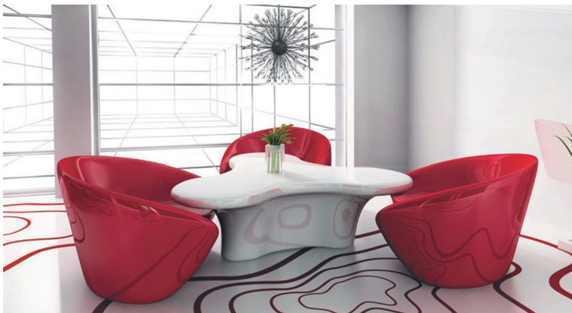
Цвет и необычность форм – ключевые аспекты стиля ар-деко