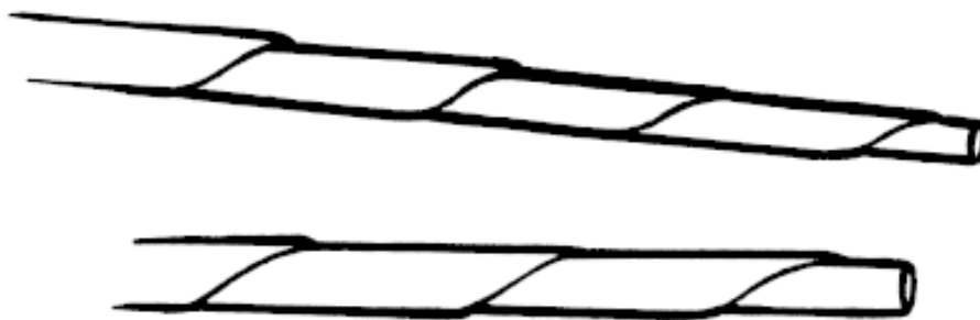
Рисунок 2. Трубочки с разной толщиной концов

Трубочки, заготавливаемые из тонкой бумаги, получаются тоньше, легче ложатся и скрепляются, они удобнее в эксплуатации. Но бывает так, что готовая вещь выглядит более фактурно, если трубочки толстые и жесткие.