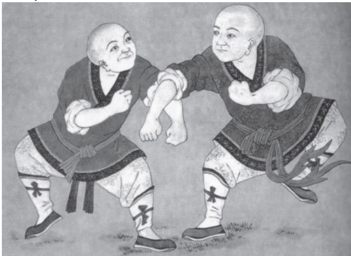
Настенные росписи «Храма десяти тысяч будд», возведенного в 16 веке

Именно в это время появляются первые серьезные трактаты об искусстве боя с оружием. Вероятно, самым первым можно считать трактат «Речения с секирой на коне» («Маюэ пу»), созданный приблизительно в V–VI веках.