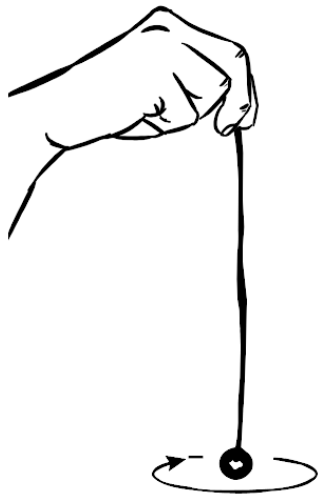
Рисунок 2. Эксперимент 2. Сфокусируйте спокойно взгляд на маятнике. Расслабьтесь. Представьте, что маятник движется по часовой стрелке по кругу, или просто «прикажите» маятнику двигаться. Что произойдёт?

Для этого эксперимента нам понадобится маятник или какой-нибудь похожий на него предмет. Возьмите верхнюю часть верёвки маятника, как на рисунке 2, и спокойно сфокусируйте свой взгляд на нем. Используя тип расслабленной концентрации, описанной в первом эксперименте, представьте, что маятник движется по кругу по часовой стрелке. Или просто «прикажите» ему двигаться таким путём. При-