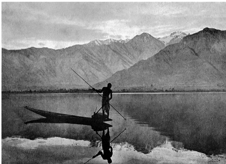
Озеро Дал в Кашмире