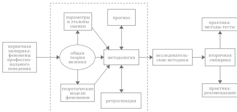
Рис. 1. Этапы разработки исследовательских методов и области их применения на практике

На рисунке 1 дана принципиальная схема методов исследования различных уровней и проблем социальной реализации профессионала: от первичной эмпирики, сбора и систематизации фактов, их концептуального обобщения, к созданию теоретических моделей исследуемых феноменов и к разработке методологических принципов, приемов и методов их исследования, – до конкретных приложений и адаптации методов к решению прикладных задач диагностики и выработки рекомендаций.