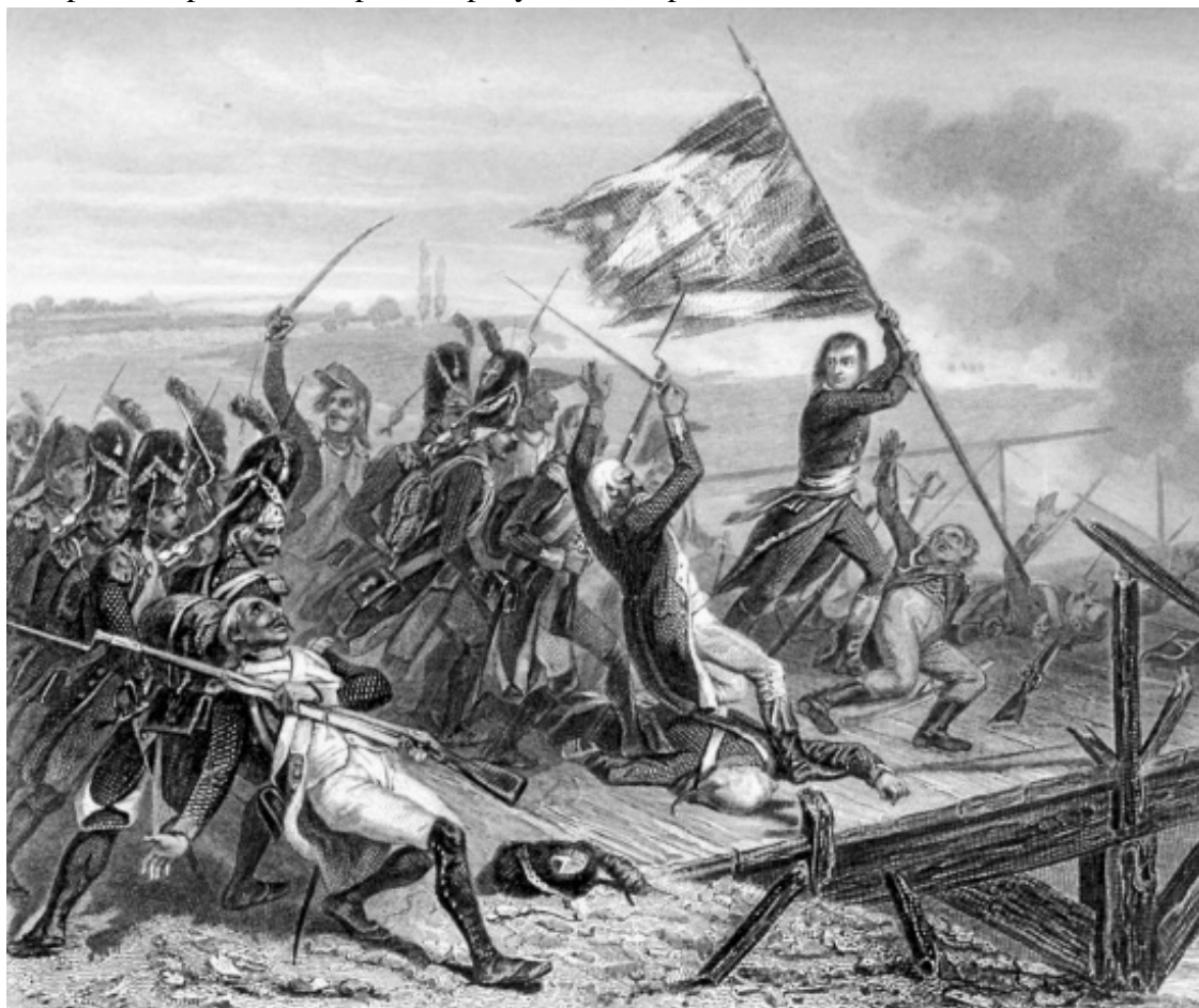
А. Тьер. Наполеон на Аркольском мосту . Гравюра. Вторая половина XIX в.

Один из его звездных часов наступил осенью 1799 г., в критический для судьбы революционной Франции момент. В отсутствие Бонапарта, покорявшего Египет, видные французские генералы Макдоналд и Моро потерпели ряд серьезных поражений в Италии от «русского Марса» А. В. Суворова. Серюрье с Груши и Периньоном и вовсе оказались в плену, и Suvaroff уже собирался через Швейцарию вторгнуться во Францию.