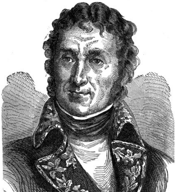
К. Пеллетан. Портрет маршала Массена. Гравюра. Вторая половина XIX в.

При чтении наполеоновского «Очерка операции Итальянской армии в 1792–1795 гг.» складывается впечатление, что Бонапарт не только не подчинялся напрямую Массена, но