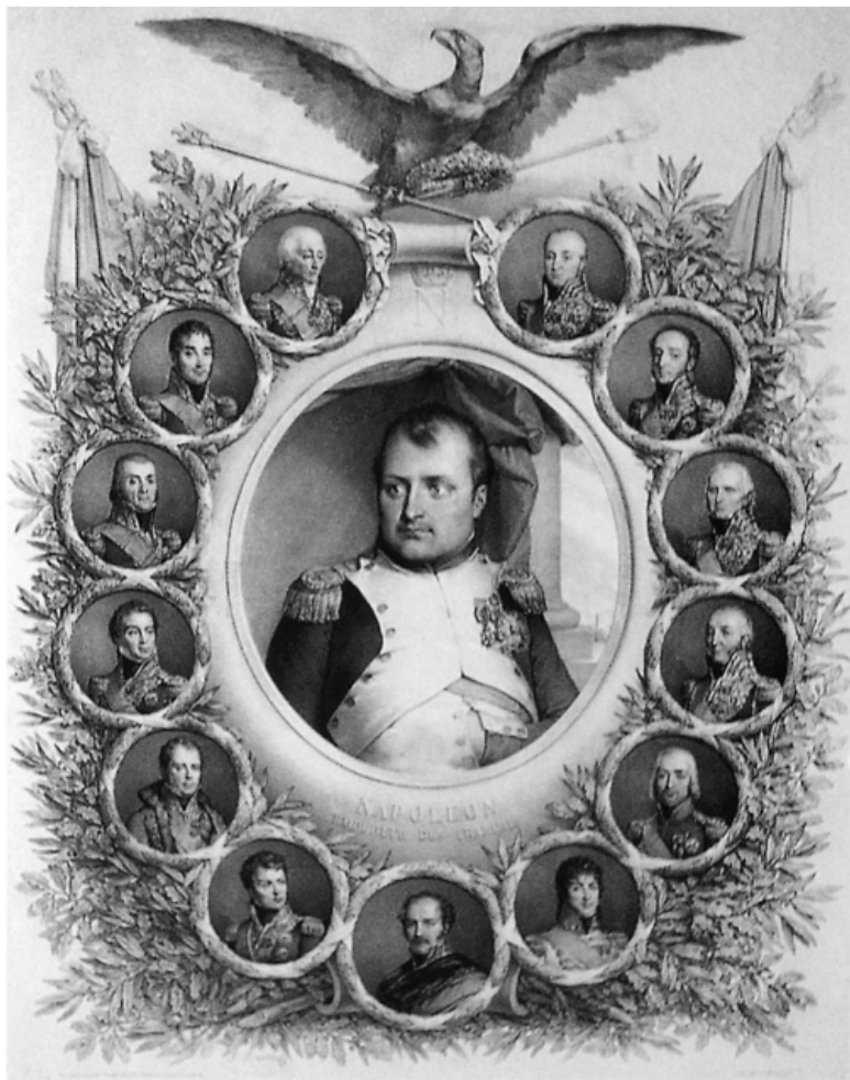
Император Наполеон I и военачальники французской армии. Литография. 1825–1830 гг.