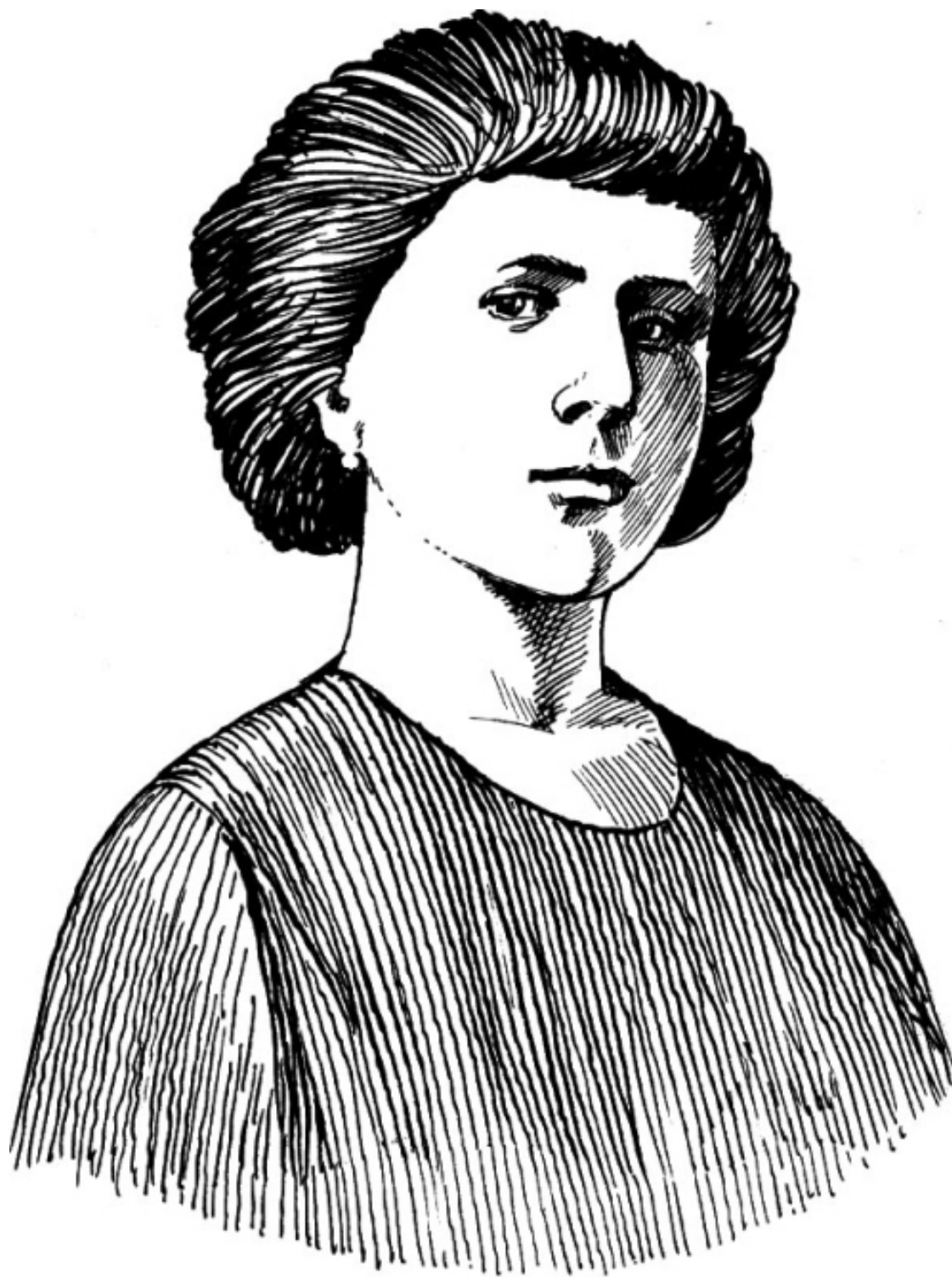
Лидия Чарская 1875 - 1937