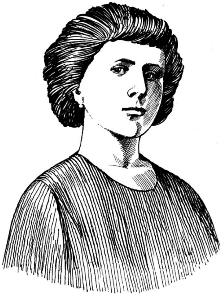
Лидия Чарская 1875 - 1937