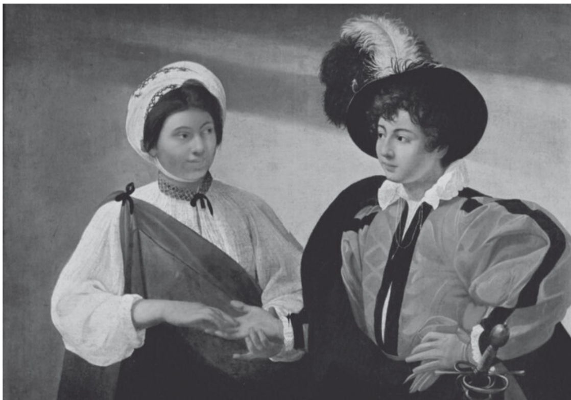
Караваджо (Италия), 1596–1597