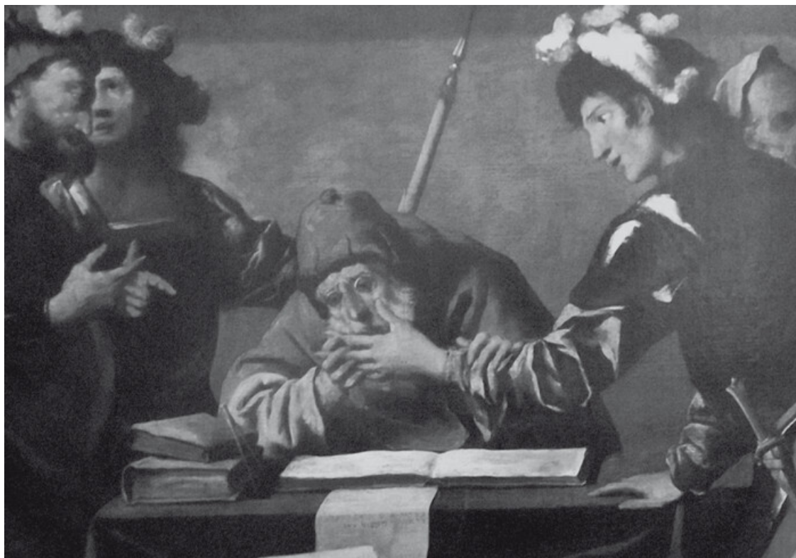
Пьетро делла Веккиа (Италия), XVII век