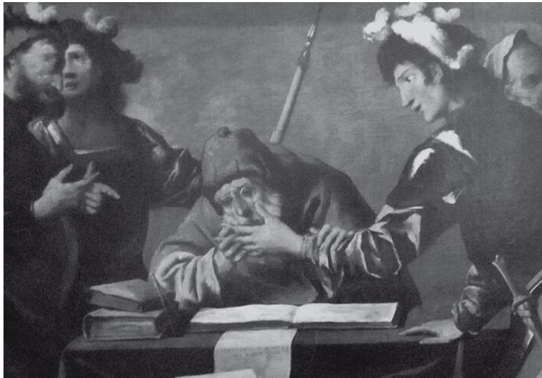
Пьетро делла Веккиа (Италия), XVII век