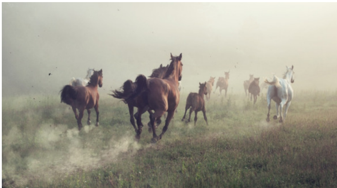
Рисунок 1: Лошади скачут в дикой природе

Поскольку у лошади нет ни острых зубов, ни когтей, ни рогов, чтобы защитить себя в случае опасности, единственный вариант, который остается у нее в случае сомнений, – бежать. Поскольку дважды подумать – значит потерять драгоценное время, лошадь сначала убегает, испугавшись, а затем на безопасном расстоянии обдумывает, было ли это вообще необходимо. Жизнь в группе, с другой стороны, значительно облегчает жизнь лошади как летающего животного. С одной стороны, группа означает безопасность, потому что хищникам гораздо труднее выбрать жертву из большой группы, которая бежит вместе, и сосредоточиться на ней. С другой стороны, это гарантирует, что одна лошадь всегда «сканирует» окружающую среду на предмет потенциальных опасностей, а остальные могут спокойно кормиться или отдыхать.