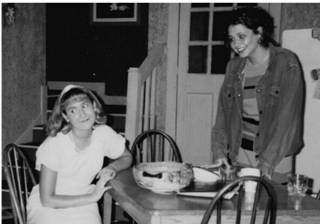
«Преступления сердца», Государственный университет Трумэна, 1995 г.

На занятиях по театральному мастерству было просто круто . У нас был урок, на котором мы садились в кружок и массажировали друг другу плечи. Я не шучу. Обучение массажу было частью расписания. Вот он, тщательно хранимый секрет всех, кто учится на актера! Были и другие упражнения: например, надо было стоять перед всей группой и рычать как лев, или двигаться как белка. У меня была сцена, где я повторяла одну и ту же фразу снова и снова с разными интонациями. Такие упражнения могут показаться глупыми или бессмысленными, когда о них читаешь, но поверьте мне: они превращают вас в актера. Мы работали над голосом, движением, проработкой героя. Мы читали горы пьес, ставили кучу сцен. Выучивание реплик было привычным делом.