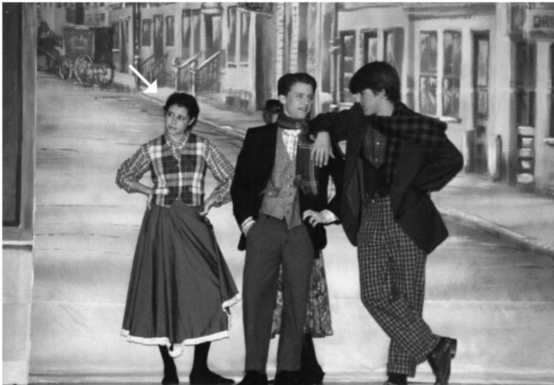
Третий год в старшей школе

Нужно ли говорить, что, пока я росла, окружающие и подумать не могли о том, что однажды я добьюсь успеха как актриса? Разумеется, теперь мои преподаватели из театрального кружка радостно обсуждают, насколько «очевидным» был мой талант с юных лет. Я по-прежнему близко общаюсь со многими из них, и, когда они говорят, что «видели во мне что-то», это просто уморительно. Ага, вы видели меня в хоровой группе!