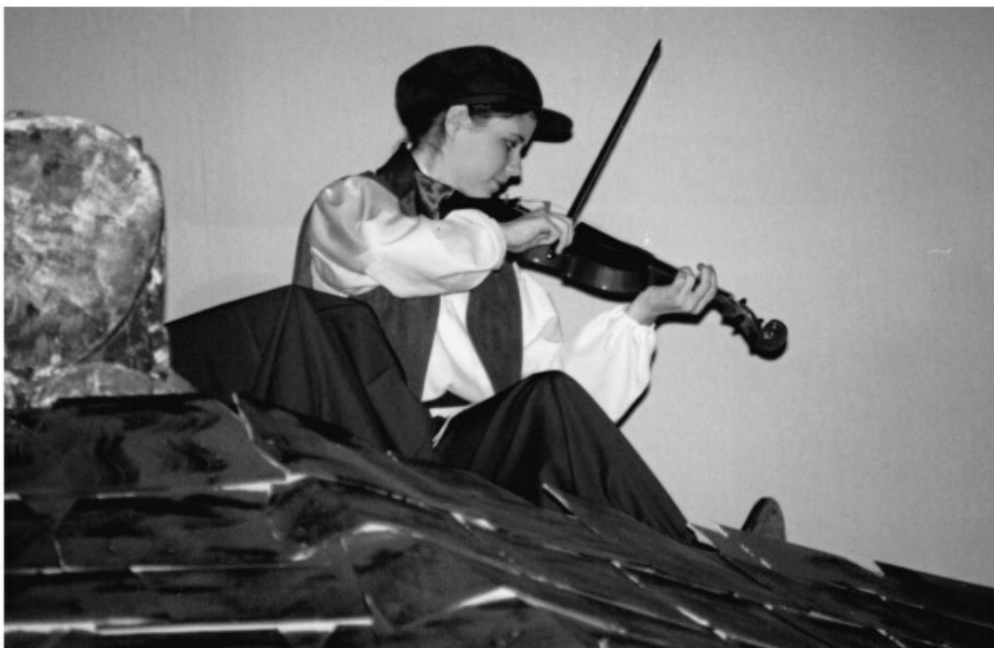
«Скрипач на крыше», 1991 г.

Я прибыла туда в типичный калифорнийский день. Яркое солнце, голубое небо, кроны пальм трепещут от бриза. Я свернула с шоссе 101 Freeway – и вот он, Голливуд. То был мой первый день в Лос-Анджелесе, и все казалось идеальным. А потом шесть лет ничего не происходило. Ну, то есть кое-что происходило, и о некоторых событиях вы прочтете в этой книге. Но мне понадобилось шесть лет, чтобы начать жить как актриса. Шесть очень долгих лет. Шесть лет слез, накапливающихся долгов и паршивых квартирок. Шесть лет крошечных удач, за которыми следовали горы отказов. И еще два года, прежде чем я получила роль Пэм Бисли в сериале «Офис».