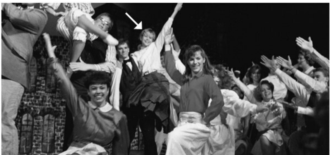
Второй год в старшей школе