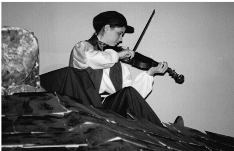
«Скрипач на крыше», 1991 г.

машину – тогда у меня была Mazda 323 Hatchback – и начала долгий путь из Сент-Луиса в Лос-Анджелес.