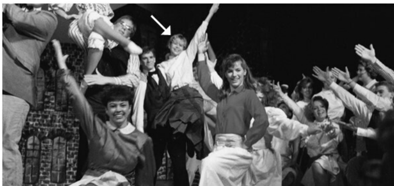
Второй год в старшей школе

Обычно мне предлагали утешительный приз: место в хо-