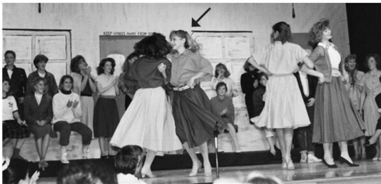
Первый год в старшей школе