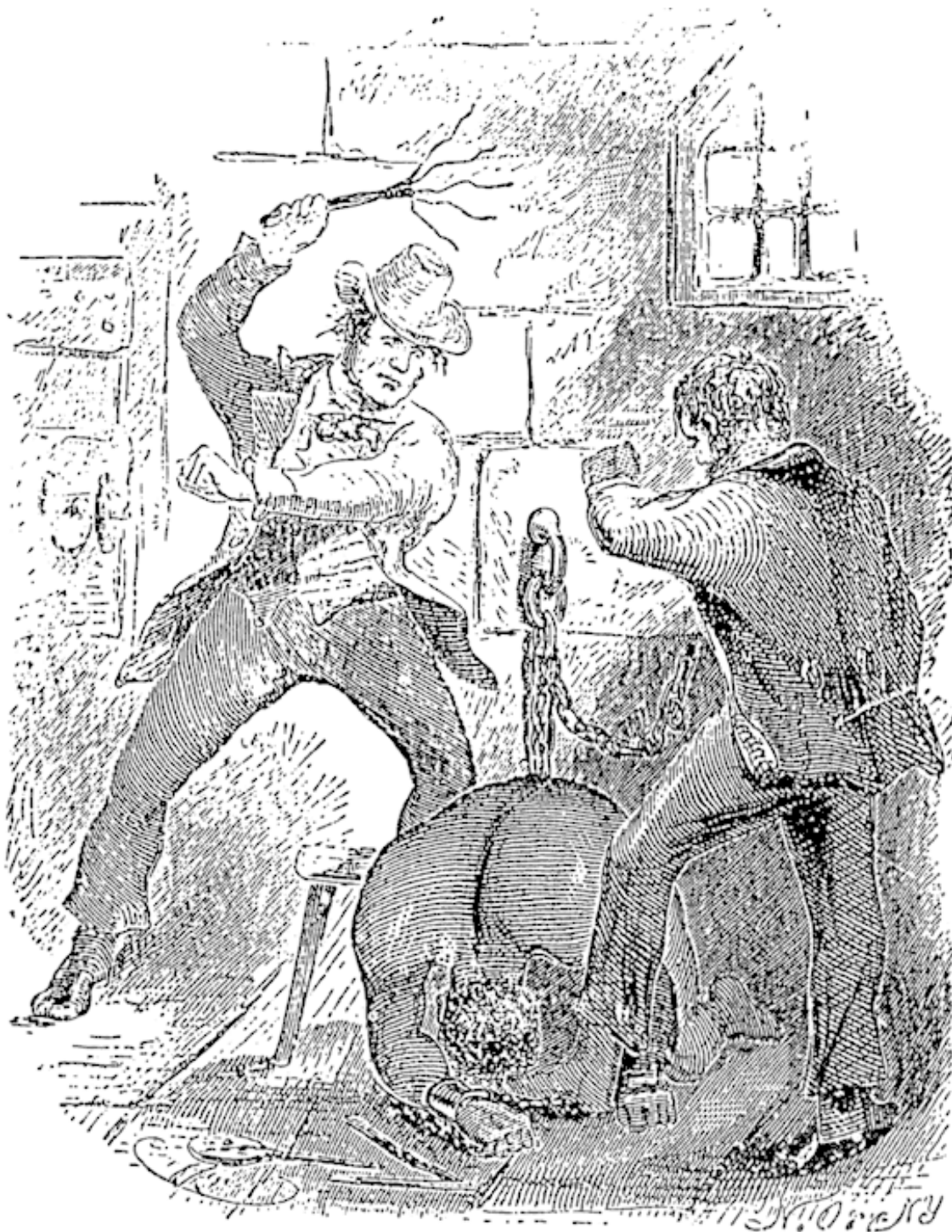
Сцена в невольничьем загоне в Вашингтоне

Спустя час или, может быть, два сердце мое затрепетало в груди, когда в двери снова заскрежетал ключ. Я, которому было так одиноко, который так пламенно жаждал увидеть хоть кого-нибудь, неважно кого, теперь содрогался при мысли о приближении человека. Человеческое лицо внушало мне страх, особенно лицо белого. Вошел Рэдберн. Он держал оловянную тарелку с куском ссохшейся жареной свинины и ломтем хлеба и чашку воды. Он спросил, как я себя чувствую, и отметил вслух, что я получил довольно суровую порку. Он принялся увещевать меня – мол, глупо упорствовать, что я будто бы вольный. В покровительственной и доверительной манере он намекал: чем меньше я буду говорить об этом, тем для меня же лучше. Рэдберн явно пытался казаться добрым: то ли его тронуло зрелище моего печального состоя-