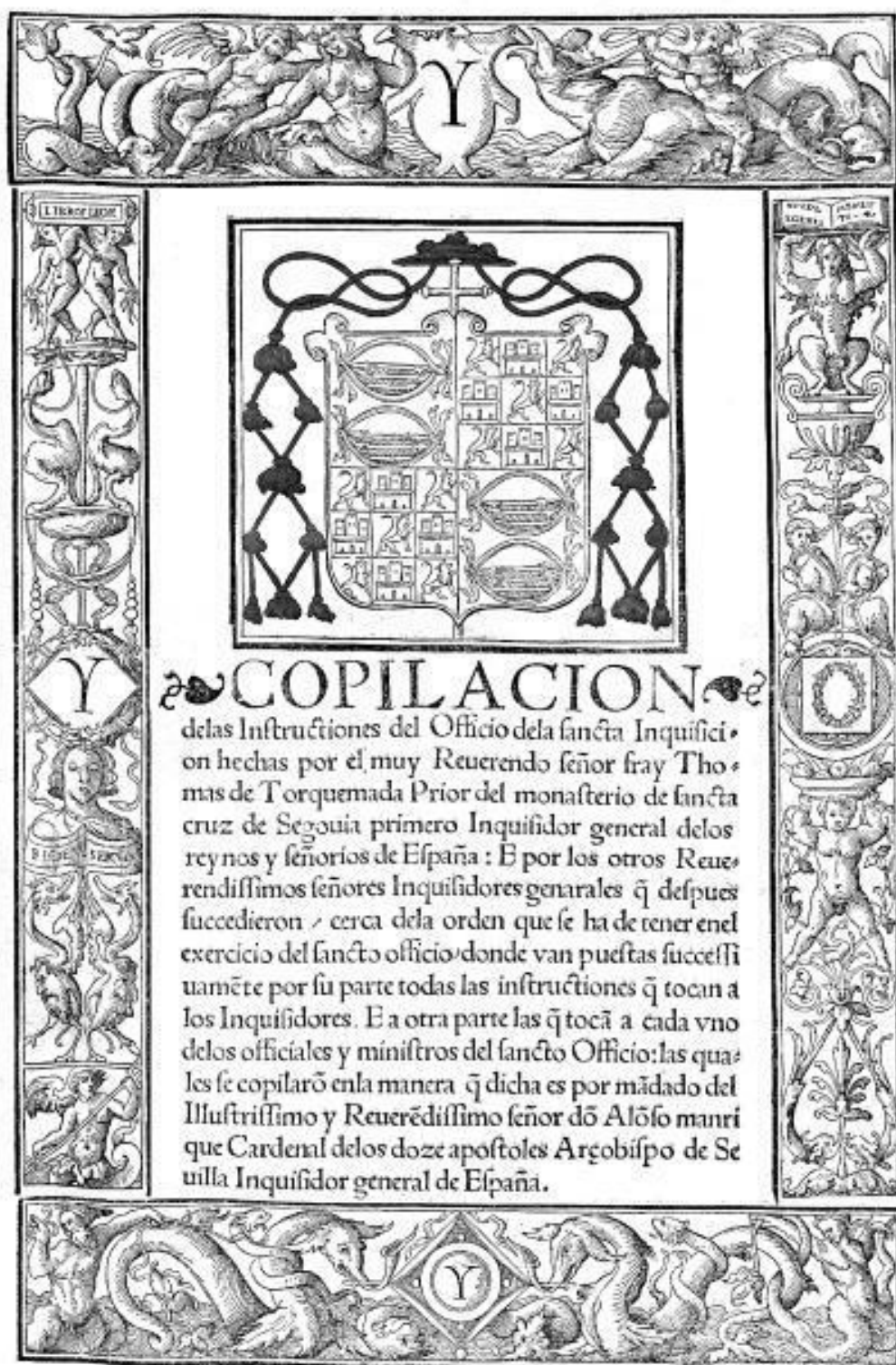
Сборник инструкций канцелярии Святой Инквизиции, составленный Томасом де Торквемада. Гранада, 1537 г.