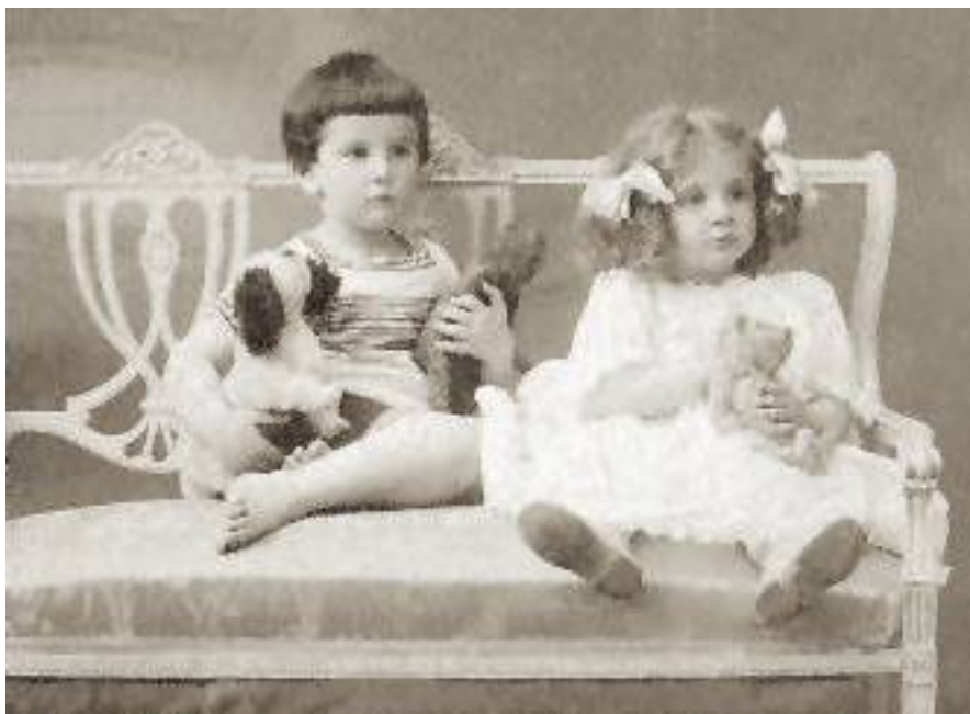
«Дети Империи» (мама и ее двоюродный брат).

Холодильников тогда еще ни у кого в квартире не было. Помню, у родителей в комнате стоял диван с двумя тумбами карельской березы, под которыми хранились нехитрые припасы к празднику. Стеклянные банки с мутноватым зеленым горошком и каперсами. То и другое предназначалось для неперемного «гостевого» блюда под названием «Салат». Теперь это называют «оливье», но тогда называлось просто «салат». Что будем готовить на день рождения? Салат. И все понимали, какой. Других просто не знали. Я опросила многих моих ровесников и все вспомнили, что тогда слово «оливье» никто не употреблял, оно прилипло к «салату» примерно в начале восьмидесятых. Хорошо помню, как в семидесятых в Москву из Одессы приехал сын папиного фронтowego друга и мой друг со своей женой. И хотя все знали, что данная жена не большой подарок, но мы с мамой решили, что это не наше дело и приготовили ужин по всем законам московского гостеприимства. Стол ломился и среди прочего был и пресловутый салат. Дама, видимо, считала, что есть в гостях – дурной тон и сидела с постным видом. Наконец, мама не выдержала: