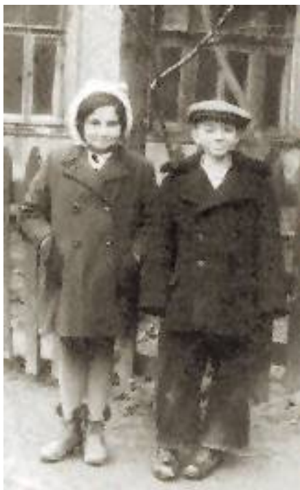
«Дети Галактики» (Серенька и я).

Картошка не должна преобладать! Итак, картошка, морковка, яйца, горошек, вареное мясо или курица, или крабы, а можно только овощи. Немного каперсов, зеленый лук, укроп, петрушка. Однажды папу послали на рынок за зеленым луком, но он принес лук-порей. Мы попробовали и с тех пор клали только порей! Все мелко порезать, смешать... Ах да, я забыла про огурцы. Можно соленые, можно маринованные, а можно те и другие и, разумеется, свежий огурчик. В моем детстве свежих огурцов зимой не было, в молодости можно было, например, к Новому году за бешеные деньги купить один маленький огурчик на рынке, «для запаха». Итак, все перемешайте, посолите, добавьте черный перец и обязательно чайную ложку сахара и майонез. Некоторые кладут в салат еще яблоко, но я это терпеть не могу. Кстати, укроп и петрушка тоже позднейшее дополнение.