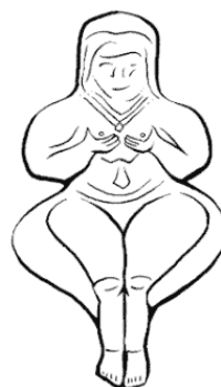
Иштар/Инанна/Астарта из Вавилона 2000 до н. э.