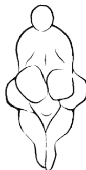
Венера из Леспю 25 000 до н. э.