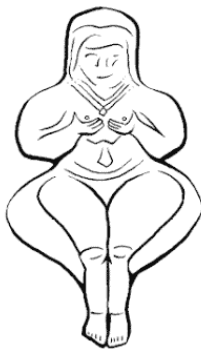
Иштар/Инанна/Астарта из Вавилона 2000 до н.э.