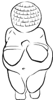
Венера из Велленгорфа 30 000 до н.э.