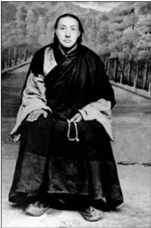
Дилго Кхьенце Ринпоче, фотостудия в Лхасе.