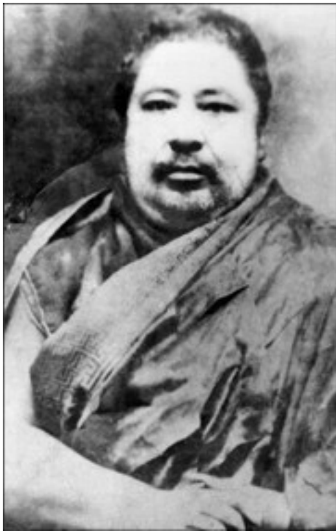
Кхатог Ситу Чокьи Гьяцо, Третий Кхатог Ситу Ринпоче.

На следующий год Кхатог Ситу отправился в путешествие в сопровождении множества монахов в Цадра Ринчен Драг 4 ,