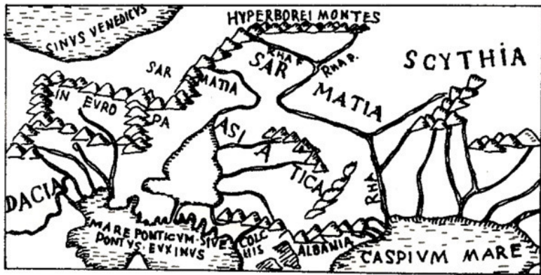
Часть карты из «Географии» Птолемея (Рим 1490)

от «Скифии до Индии», и автор «Этногеографии Скифии». Но так как текст, как мы уже убедились ранее, можно интерпретировать по-разному для доказательства взаимоисключающих концепций, обратимся к карте Птолемея, вернее, к той ее части «Географии» (изданной в Риме в 1490), где на севере изображена цепь гор, названных Гиперборейскими (HYPERBOREI MONTES), и, приводя которую, Г. Бонгард-Левин и Э. Грантовский говорят об ошибке Птолемея, поместившего на севере горы, которых нет.