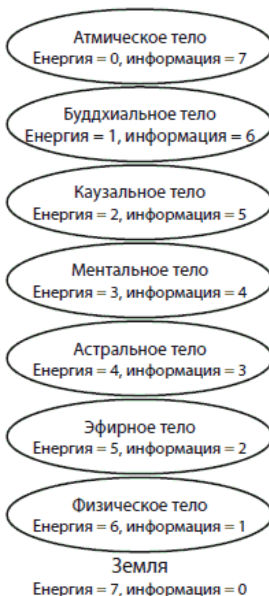
Рис. 3. Структура строения сознания человека с указанием энергии и информации

Витальное и творческое, как ты уже знаешь, всегда находятся во вполне объективном противоречии – ведь у тела и духа разные задачи. Все остальные твои тонкие тела нужны для того, чтобы энергетически и информационно устранять это противоречие, согласовывая и усмиряя потребности тела перед духом или диктат духа над телом.