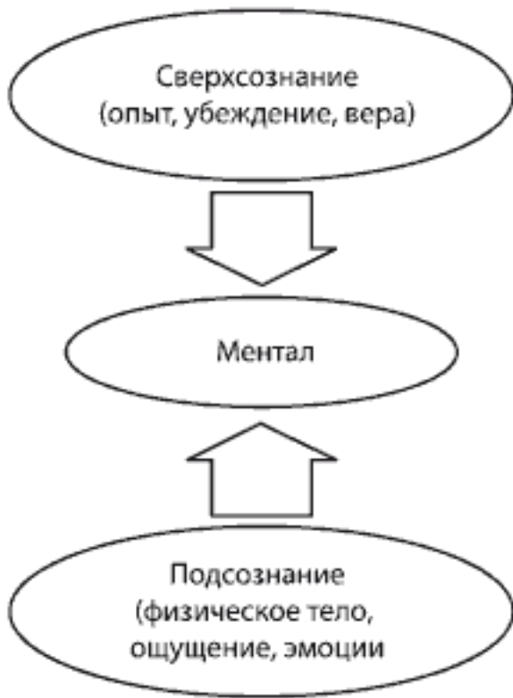
Рис 1. Три кита сознания

Подсознание бездумно, но оно – надежный и верный охранник. Разума в нем нет, оно не думает. Ему нет совершенно никакого дела до того, к чему стремится человек, ка-