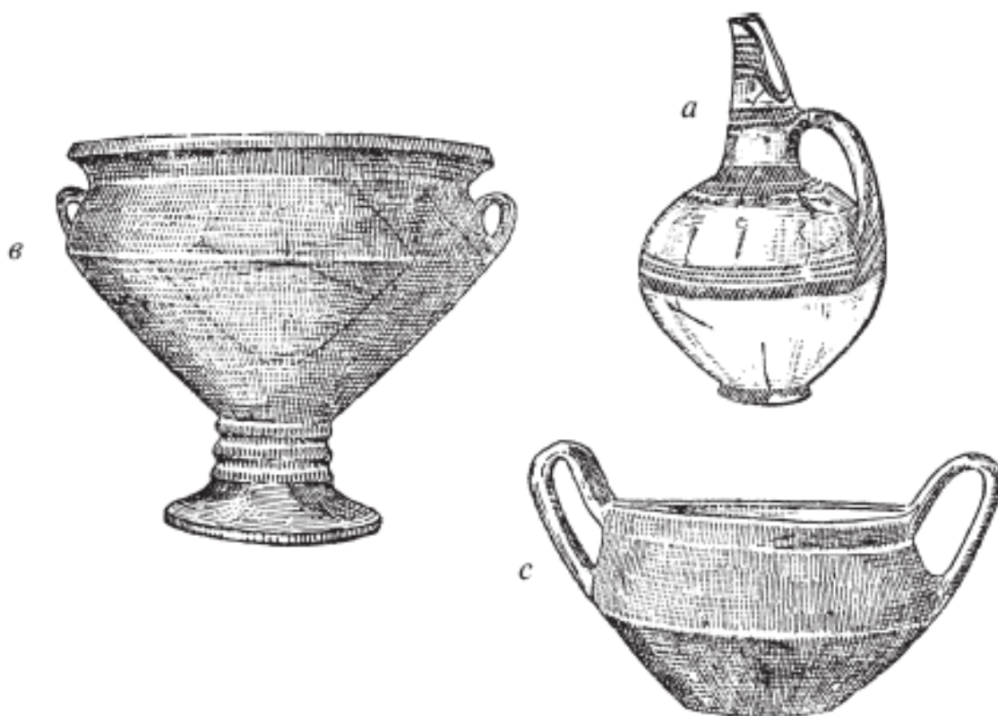
Рис. 2. Среднеэлладская керамика: а – матовый раскрашенный сосуд из Микен; в , с – миньянские изделия из Кораку (по Уэйсу и Штуббингу)

Миньянскую керамику легко отличить от всех других серых изделий благодаря превосходному качеству и весьма специфической технике отделки. Скорее всего, ее принесли в Грецию представители одного из кочевых племен. В форме ваз скопированы металлические изделия, а техника отделки позволяет предположить, что они являются копиями серебряных сосудов.