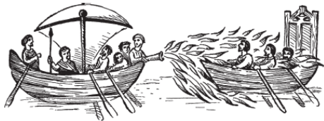
Рис. 2. Применение «греческого огня» с помощью насоса

Так как ни одно государство, кроме Византии, не освоило производство этой секретной горючей смеси, с 1097 года, времени начала Крестовых походов, стали использоваться различные его имитации, в большинстве случаев представляющие собой давно уже известную смесь серы и битума со смолой хвойных деревьев или другими клейкими веществами с добавлением нефти или иных составляющих. Написанное ритмизованной прозой повествование о Ричарде Львиное Сердце, относящееся ко времени правления английского короля Эдуарда I, сообщает нам, что: