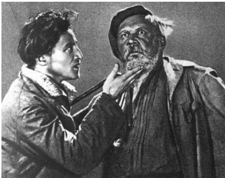
Ф. Эрмлер и В. Гардин перед съемкой

А в такой же верной роли слесаря Бабченко Гардин известен всем знатокам старого кино в одном из первых советских звуковых фильмов «Встречный».