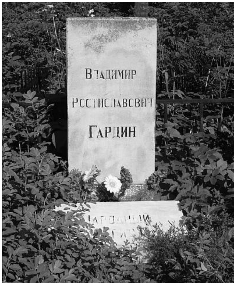
Могила В. Гардина на Богословском кладбище

Меня уже давно беспокоит мысль о том, что не случайно