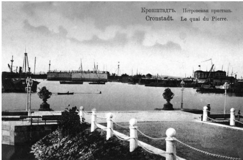
Кронштадтъ. Петровская пристань. Cronstadt. Le quai du Pierre.