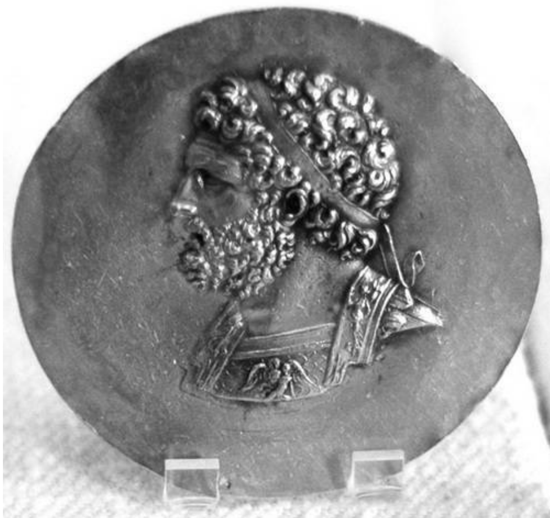
Золотой медальон с портретом Филиппа II

Благодаря энергичным усилиям Демосфена, давнего противника Филиппа, а теперь еще и одного из руководителей Афин, образовалась антимакедонская коалиция, включавшая целый ряд греческих городов; стараниями Демосфена к союзу был привлечен сильнейший из них – Фивы, до сих пор бывшие в союзе с Филиппом. Давняя вражда между Афинами и Фивами уступила место чувству опасности, вызванному возросшим могуществом Македонии. Соединенные силы этих государств попытались выдвинуть македонцев из Греции. Союзники даже одержали победы в двух небольших сражениях. Но вопрос о судьбе и свободе Эллады должен был решиться в последней, генеральной битве, в которую обе противоборствующие стороны собирались бросить все имевшиеся силы.