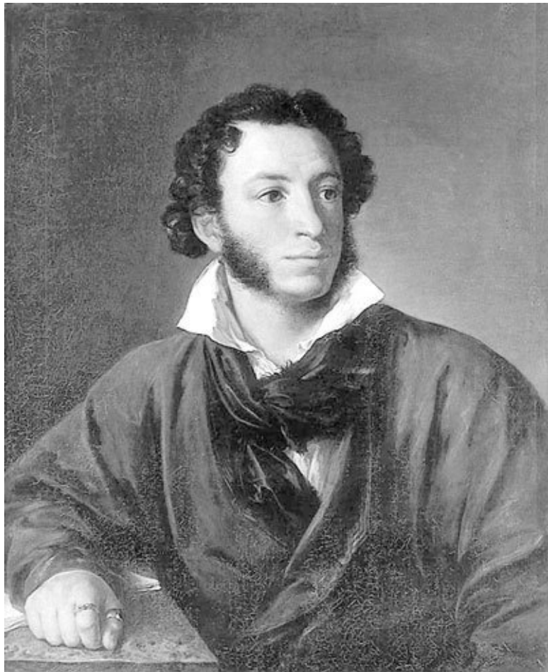
В.А. Тропинин. Портрет Александра Сергеевича Пушкина. 1827 г.