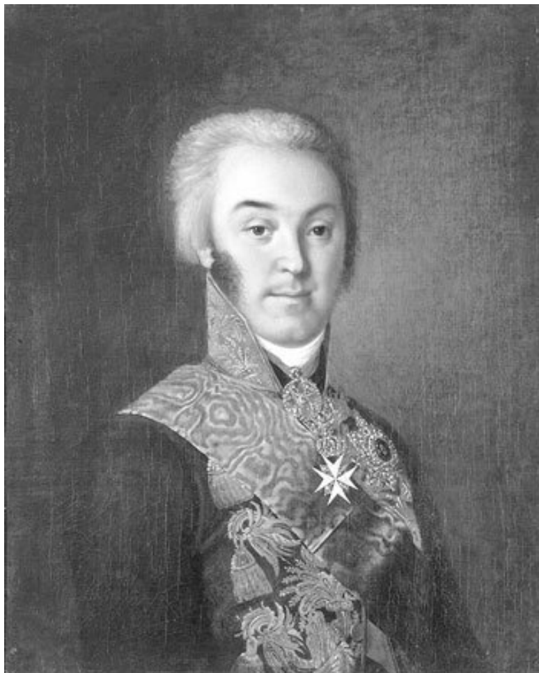
Граф Николай Петрович Шереметев