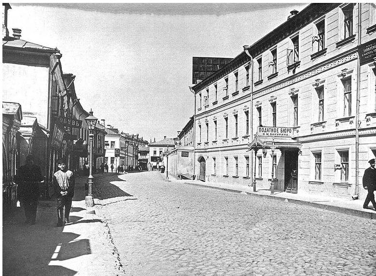
Большой Кисловский переулок в сторону Большой Никитской улицы. 1913 г.

Возможно, что этот дом включил в себя и части древних палат боярина Богдана Матвеевича Хитрово, стоявших в XVII в. как раз на этом месте. В XVIII в. участок принадлежал обер-президенту магистрата С.С. Зиновьеву, потом – стольнику С.Т. Клокачеву, с 1761 г. – князю А.С. Голицыну и в 1765 г. – младшему из знаменитых братьев Орловых, возведших Екатерину на престол в 1762 г., Владимиру Григорьевичу.