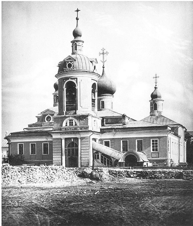
Церковь Антипия в Конюшенной

Крошечный, уже покосившийся и вросший в землю дом