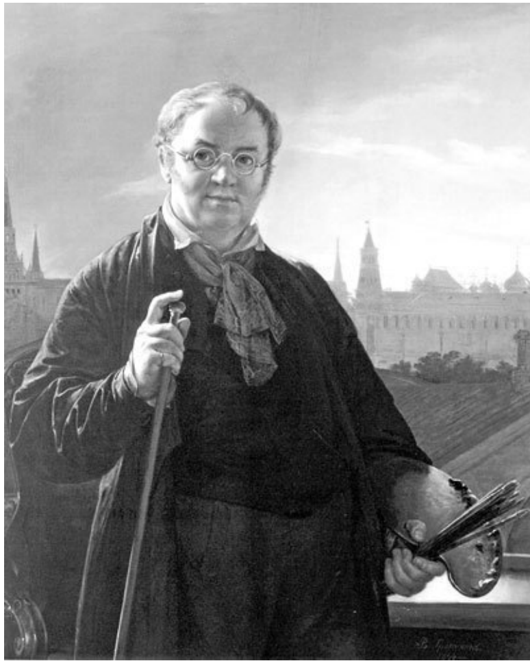
Василий Андреевич Тропинин. Автопортрет