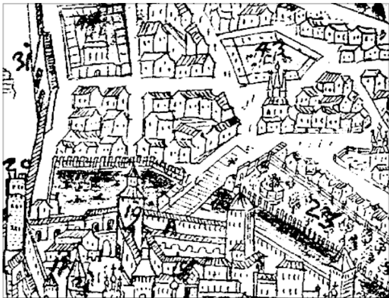
На плане Мейерберга 1661 г. Лебяжий пруд (№ 45) у Боровицкой башни (№ 19)

Итак, герцог встретился с сильной дворянской оппозицией, хотя Висмар и остался у него, но Петр был здесь ни при чем. Содержание десяти русских полков было невыносимым бременем, а тут еще и взбалмошный и непредсказуемый характер герцога. В результате Екатерина с двухлетней дочерью, будущей правительницей России Анной Леопольдовной, отправилась обратно на родину. Она жила в Петербурге, покровительствовала поэту Тредиаковскому, который так