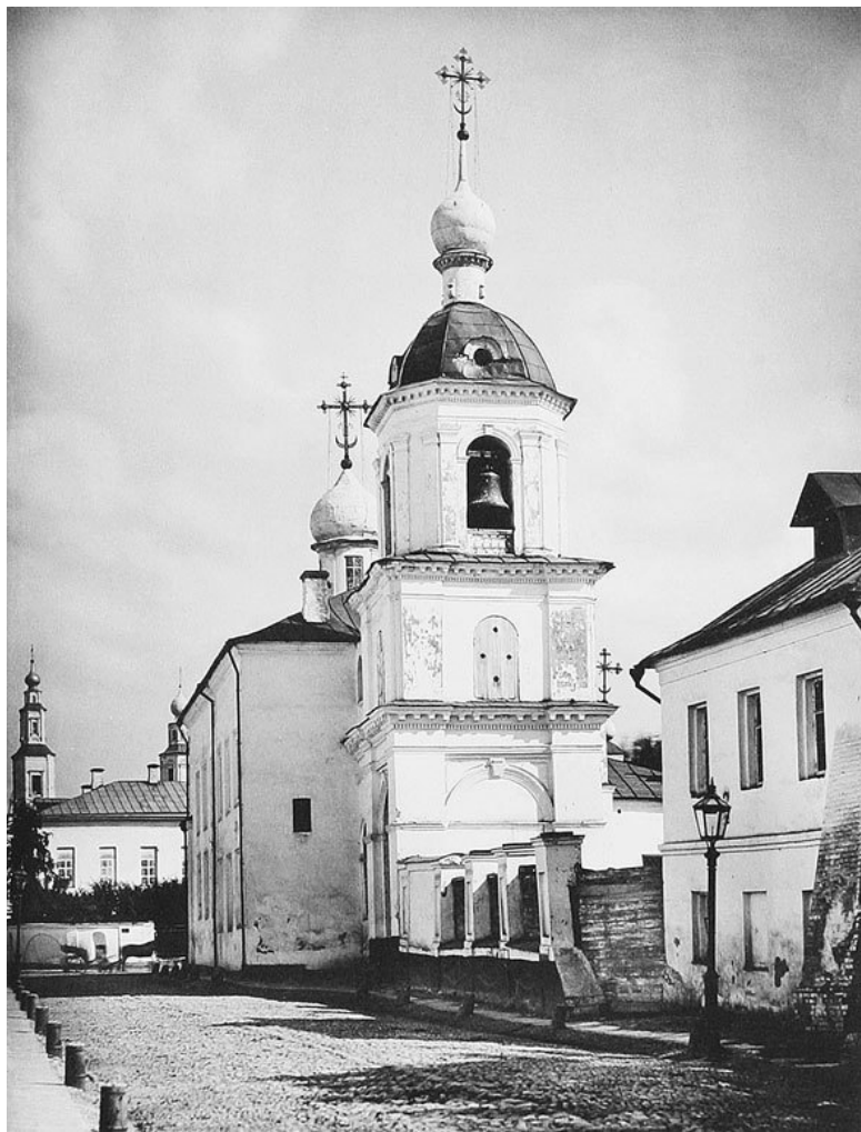
Церковь Знамения на Знаменке