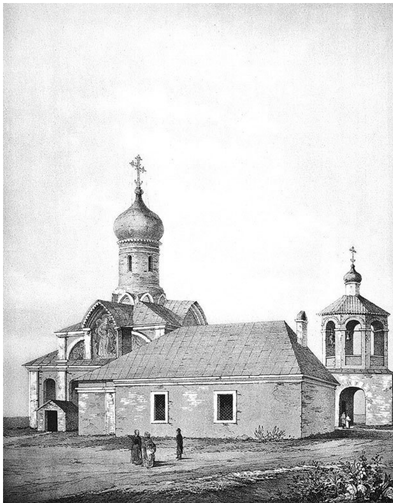
Церковь Благовещения в Старом Ваганькове