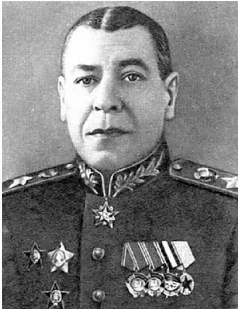
Маршал Борис Михайлович Шапошников