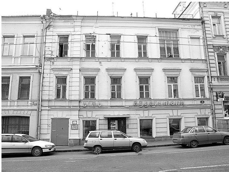
Ленивка, дом № 3