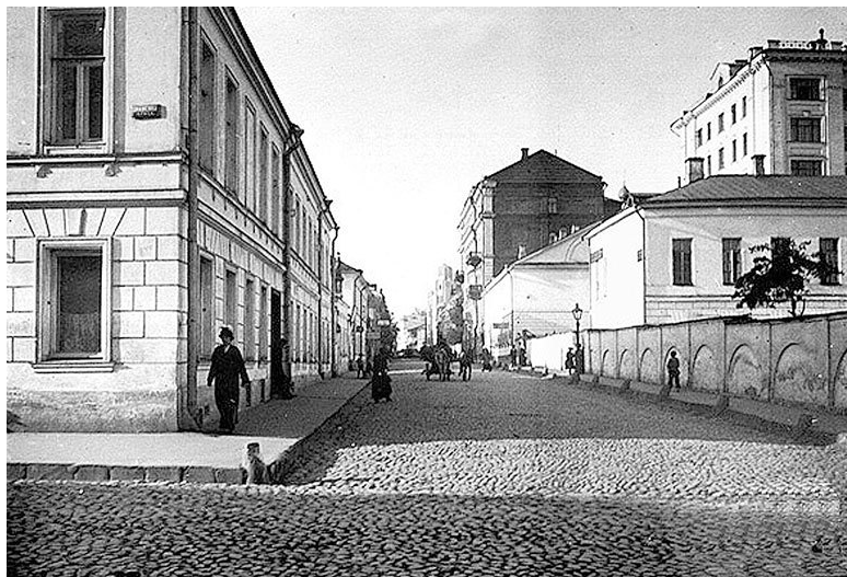
Крестовоздвиженский переулок от Знаменки. 1913 г.

енный в 1823 г. Этот дом был связан с памятью о А.С. Пушкине: здесь он в первый раз появился в обществе с Натальей Николаевной после свадьбы. Дом снимала Н.М. Щербинина (дочь знаменитой Екатерины Романовны Дашковой), и она давала 20 февраля 1831 г. бал. А.И. Кошелев писал В.Ф. Одоевскому на следующий день: «Вчера на бале у Щербининой встретил Пушкина. Он очень мне обрадовался. Свадьба его была 18-го, т. е. в прошедшую среду. Он познакомил меня с своей женою, и я от нее без ума. Прелесть как хороша». В этот же дом А.С. Пушкин послал письмо с поздравлением Павла Воиновича Нащокина с рождением дочери. Нащокин жил здесь в 1834 г.