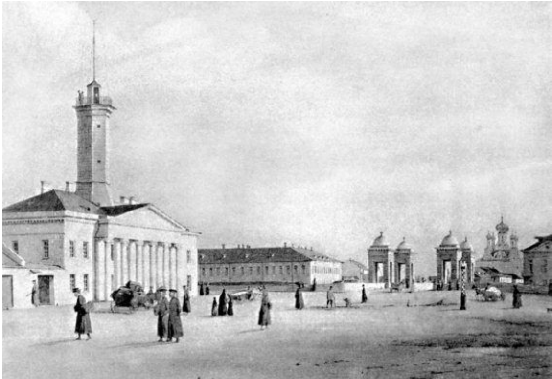
Площадь у Старо-Калинкина моста. Литография Ф.-В. Перро. Около 1840 г.

А.С. Пушкин первым воспел Коломну. 11 июня 1817 года, окончив лицей, он поселился у родителей, снимавших квартиру в доме члена Адмиралтейств-коллегии, адмирала Алексея Федотовича Клокачева, на набережной реки Фонтанки в доме № 185, рядом с Калинкиным мостом. Неширокие улицы с низенькими деревянными домами, церковью, пожарной каланчой и вылинявшими под дождем и ветром полосатыми полицейскими будками придавали тогда Коломне вид городской окраины. Фонтанка, с облицованными гранитом берегами, окаймленная кружевами чугунных решеток, несла свои воды в Балтийское море. Двухэтажный на полуподвале дом вице-адмирала А.Ф. Клокачева, лишенный всяких украшений, кроме фигурных оконных наличников, сдавался чиновникам и обедневшим дворянам, к числу которых принадлежала семья поэта. В первом этаже снимали квартиру родители его однокашника – лицеиста Модиньки Корфа.