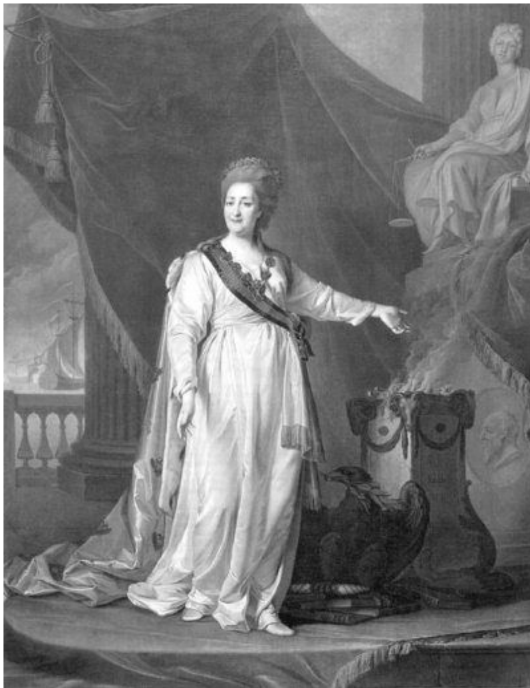
Императрица Екатерина II. Художник Д.Г. Левицкий. 1783 г.

Императрица утвердила также смету расходов на строительство нового городского канала. При этом предполагалось, что на очистку берегов Глухой речки, а также на строительство «всех мостов, крылец, съездов и перил» понадобится 368 906 рублей 49 копеек. Утверждая смету, императрица указала, что «для избежания лишних расходов предусмотреть, чтобы все подряды и закупки производились с должною бережливостью, строго по указам и регламентам канцелярии Главной артиллерии и фортификации, без посредства особых комиссионеров».