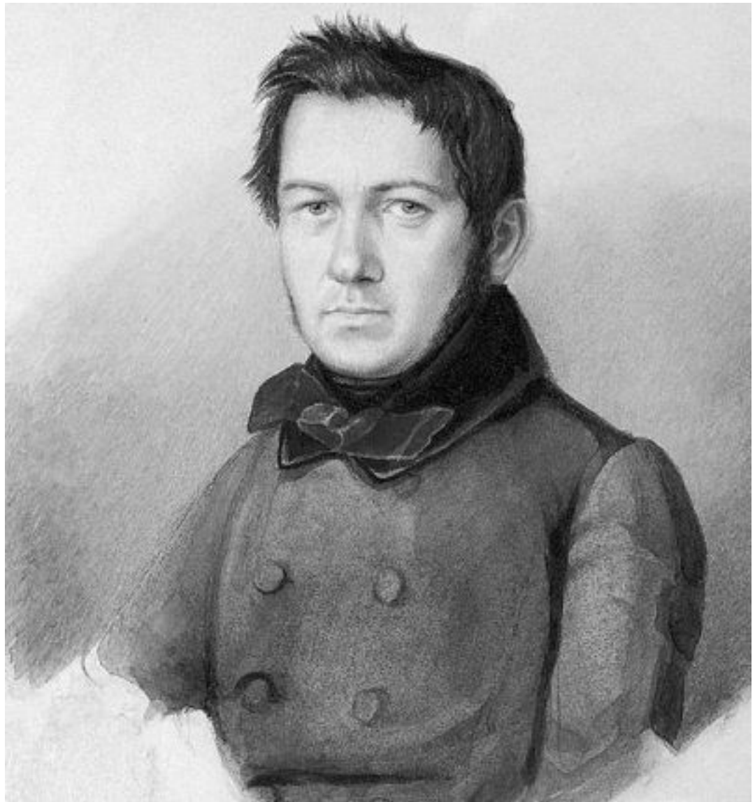
Композитор М.И. Глинка. Портрет работы К.П. Брюллова. 1840 г.(?)