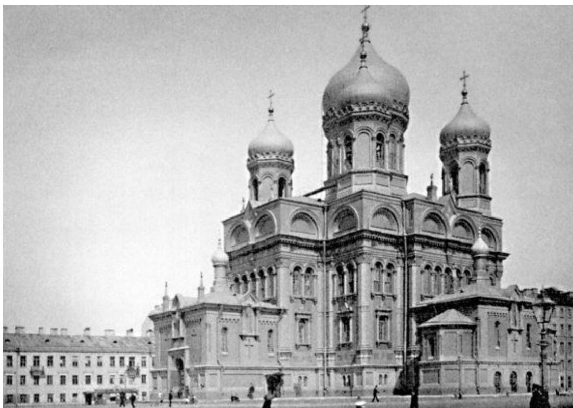
Церковь во имя Воскресения Христова на Воскресенской площади. 1900-е гг.

Трехпрестольная церковь Воскресения Христова имела два этажа, три придела: главный, во имя Воскресения Христова, и названные боковые устроили в верхнем этаже. В нижнем располагались вертеп Рождества Христова по образцу Вифлеемского и еще два боковых придела. Интерьеры нижней церкви выполнили в 1870-е годы по проекту архитектора С.В. Садовникова.