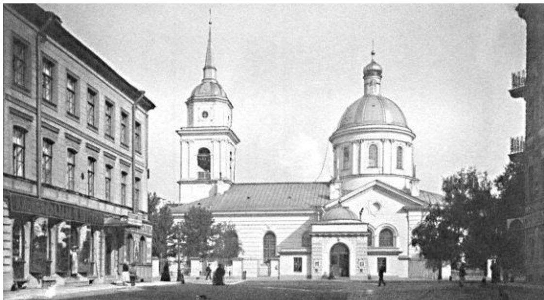
Церковь Покрова в Большой Коломне. 1900-е гг.

В церкви обустроили три престола: главный – во имя Покрова Пресвятой Богородицы освящен 30 сентября 1812 года; правый – во имя собора святого Иоанна Крестителя – 1 ноября 1808 года; левый – во имя святой равноапостольной Марии Магдалины – 20 ноября 1808 года. В иконостасе – образа работы академиков братьев Малковых. Главной святыней храма являлся чудотворный образ святителя Николая.