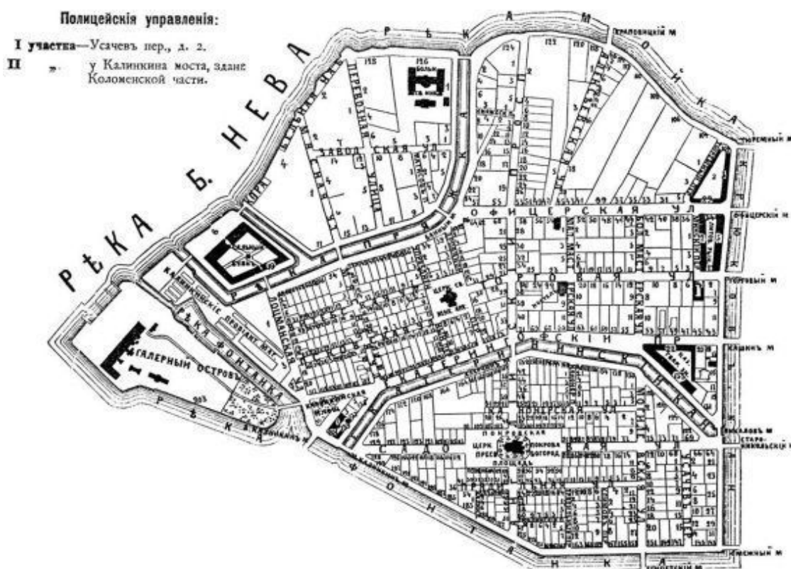
План Коломенской части Санкт-Петербурга.