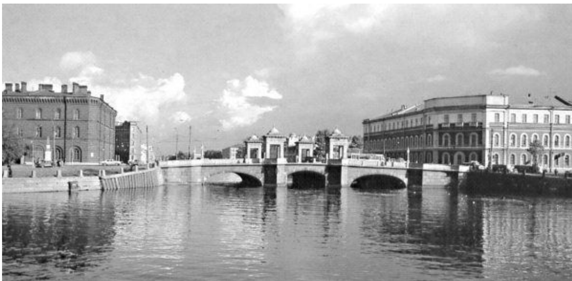
Старо-Калинкин мост. Фото 1989 г.

Квартира Пушкиных располагалась во втором этаже и состояла из семи больших комнат, три из которых (парадные) выходили десятью окнами на Фонтанку. Старо-Калинкин мост с квадратными гранитными башнями и массивными чугунными цепями был достопримечательностью этого участка Фонтанки. Путники, въезжавшие в город по Петергофскому тракту, пересекали мост и далее, мимо верстового мраморного столба с солнечными часами и цифрой 26 (расстояние от Петергофа до Фонтанки), попадали на Калинкину площадь, разбитую в XVIII веке архитектором А.В. Квасовым.