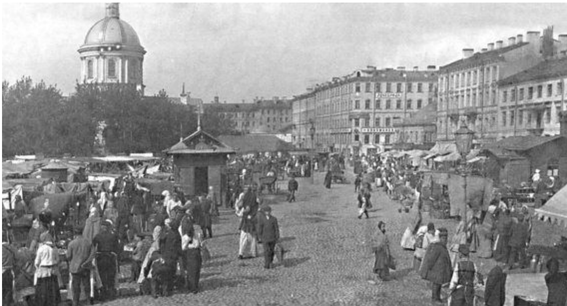
Базар на Покровской площади в Большой Коломне. 1900-е гг.

Археологи при раскопках нашли также перстень-печатку из белого металла с изображением бычьей головы и надписью на нем: «Сей перстень Дмитрия Шатина». Оказалось, что купец Шатин был хозяином салотопни, расположенной в устье реки Фонтанки. Он поставлял сало для стапелей судостроительной верфи и в Покровскую церковь.