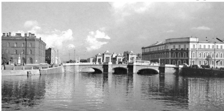
Старо-Калинкин мост. Фото 1989 г.

родской окраины. Фонтанка, с облицованными гранитом берегами, окаймленная кружевами чугунных решеток, несла свои воды в Балтийское море. Двухэтажный на полуподвале дом вице-адмирала А.Ф. Клокачева, лишенный всяких украшений, кроме фигурных оконных наличников, сдавался чиновникам и обедневшим дворянам, к числу которых принадлежала семья поэта. В первом этаже снимали квартиру родители его однокашника – лицеиста Модиньки Корфа.